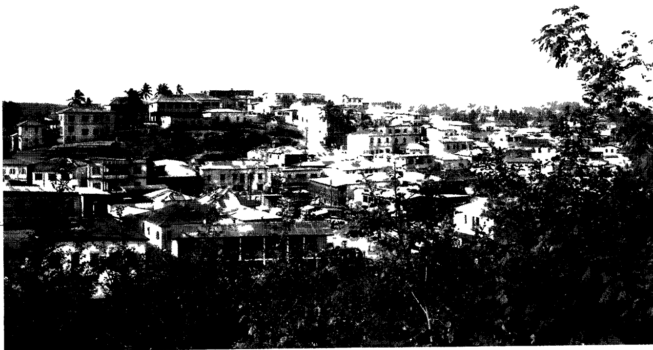
Afb 9 Java Hill, Elmina Teruggekeerde veteranen kregen een stuk grond toegewezen op een heuvel achter kasteel St George, die al spoedig bekend stond als Java Hill

gingen naar de Europese school en hadden de Nederlandse nationaliteit. De Indo-Afrikaanse afstammelingen vochten in de Tweede Wereldoorlog tegen Japan, deelden de ontberingen van de Japanse krijgsgevangenkampen en streden uiteindelijk in de politioele acties tegen de Indonesische nationalisten. Na 1949 koos de overgrote meerderheid voor overkomst naar Nederland.