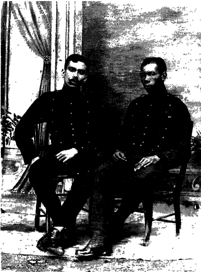
Afb. 2 Kasteel St. George d'Elmina. Hiervandaan vertrokken de Afrikaanse soldaten naar Batavia.