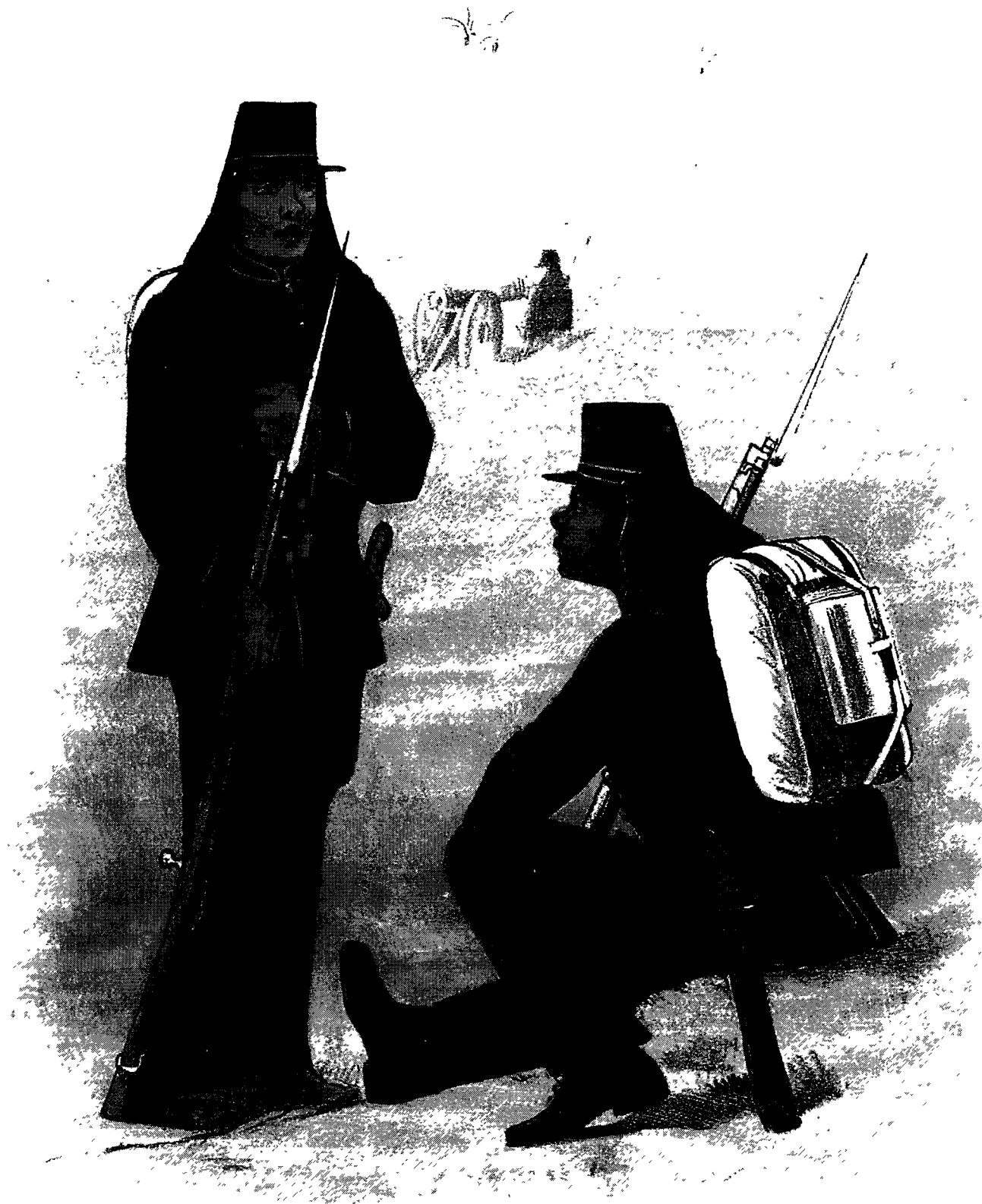
INLANDSCHE EN AFRIKAANSCH TROEPEN.