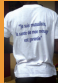
"I am insured. The health of my family is guaranteed."