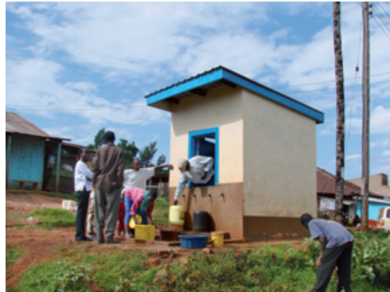
Waterkiosk van UN-HABITAT in de wijk Jogoo, Kisii.

'De ambtelijke hiërarchie van de gemeente Kisii was aanvankelijk bang voor het platform van belanghebbenden, als nieuwe machtsstructuur,' zegt Foeken. 'Maar gaandeweg accepteerde ze het platform en de watervoorziening lijkt daar nu beter te functioneren. Dat heeft onder meer te maken met de individuele toewijding van betrokkenen. Ik heb