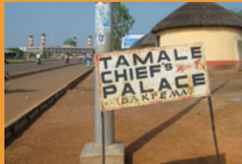
The Palace of the Dakpema, one of Tamale's Traditional Authorities.