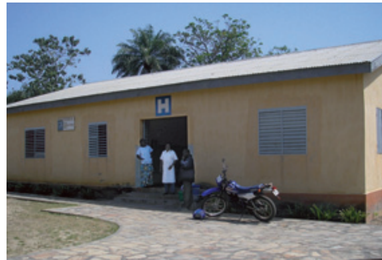
Een kliniek op het platteland van Togo waar verzekerde gezinnen terecht kunnen voor medische zorg.

Verzekerde gezinnen gaan in het algemeen sneller naar de dokter, blijkt uit de eerste fase van onderzoek. 'Wat ook naar voren lijkt te komen is een verbetering voor meisjes. Bij huishoudens die niet verzekerd zijn, zien we dat meisjes als ze klachten hebben niet snel naar de dokter gaan, jongens wel. In huishoudens die wel verzekerd zijn, valt het onderscheid tussen jongens en meisjes in die zin weg.'