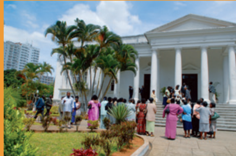
People dress very colorfully for special occasions like weddings.

For the Coloureds, Indians and Whites among the former activists it is a different story. Especially for Coloureds, the UDF was their first political home. In the fight against apartheid they identified with black South Africans, and were considered to be so by others. But the ANC is now dominated by Black African nationalism and Coloureds and Indians are no longer seen as 'black'. Ineke van Kessel admits: 'Many of the former Coloured activists I interviewed may be doing well economically but they feel they do not belong any more: their ideal of a non-racial, inclusive society has been betrayed.'