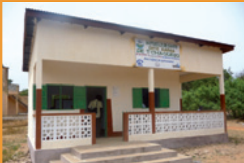
A Health Insurance Office.