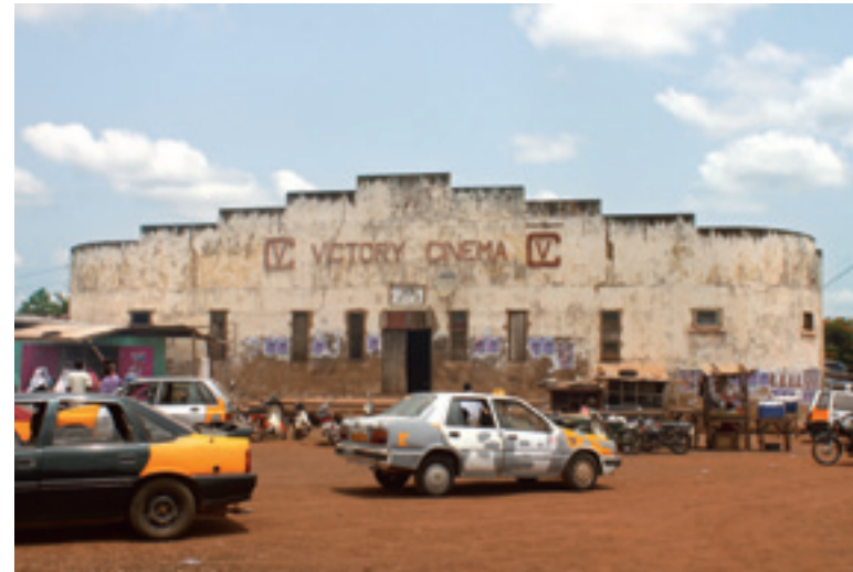
Vroege urbanisatie: de in onbruik geraakte Victoria Cinema in het centrum van Tamale.

'Wie een stuk grond of een vergunning nodig heeft, kan het langs allerlei wegen proberen. Of hij kan gewoon zijn gang gaan, of juist om arbitraire redenen stranden. Zo'n stad is eigenlijk één grote informele sector. Er is de afgelopen veertig jaar veel gejuicht over de informele sector. Maar de spanning tussen de informele sector in alsmaar