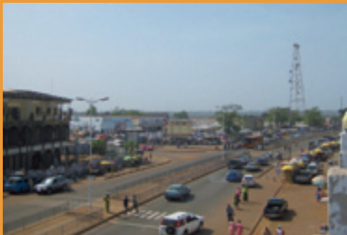
The Main Drag: Tamale's high street.