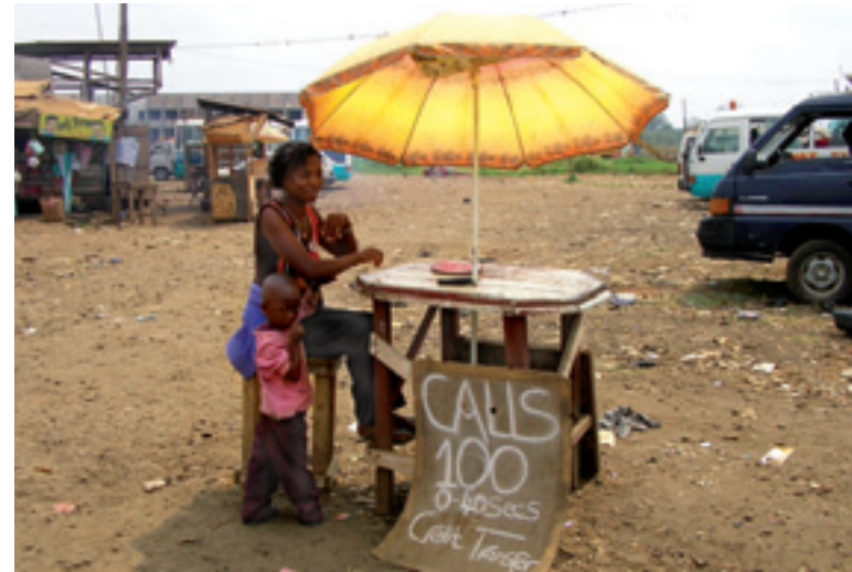
De mobiele telefoon - in wiens voordeel?