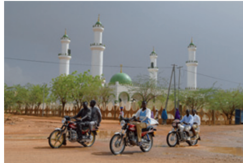
Motorfietstaxi's en een moskee, een vertrouwd beeld in veel Afrikaanse landen.

'In 1991 implodeerde de staat in Somalië. Civil society was zwak en er kwam geen nieuw gezag. Religie werd de bodem waarop politieke macht kon worden opgebouwd en zo konden radicaal-militante groepen als al-Shabaab sterk worden. In Ethiopië is de relatie tussen staat en religie beter vastgelegd en is de situatie minder ernstig. Maar ook daar vindt polarisering plaats. De islamitische en christelijke polemiek wordt gevoerd door geleterde groepen in steden en de opinies raken verspreid via CD's, VCD's, en zelfs Bluetooth of mp3-bestanden. Hoe reageren de minder geschoolde mensen buiten de steden? Sommigen zijn onder indruk van de kennis van de islam van de radicalen, anderen herkennen hún islam niet. Dat zit 'm niet alleen in hun verschillende economische situatie, die verklaring is te simpel,' zegt antropoloog Abbink. 'In sommige streken in Ethiopië is er onder