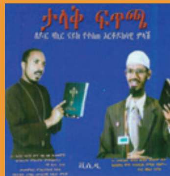
VCDs with religious polemical messages, issued recently in Ethiopia.