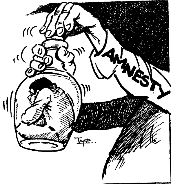
Mother of all Liberators!

Ik zal het eerst hebben over de tweede taak: hoe kan de Commissie erop toezien dat de in het Handvest genoemde grondrechten worden nageleefd in de landen die het verdrag geratificeerde hebben? Daarvoor staan de Commissie twee instrumenten ter beschikking: