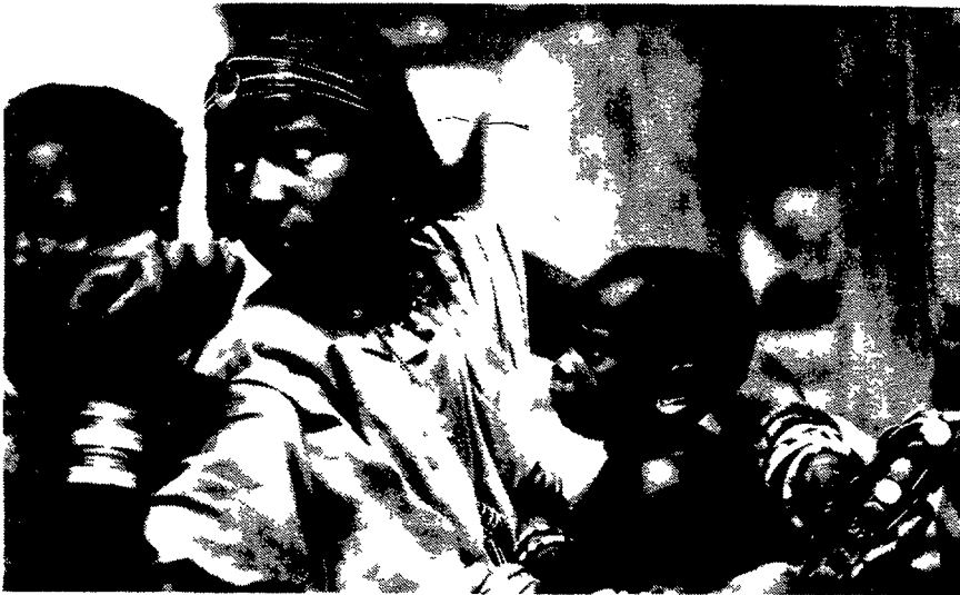
Afrika: voer voor antropologen. Links: Peul-vrouw, Rechts: Bella-vrouw.

diecentrum, in Leiden was daar heel duidelijk over: de groei is eruit en we mogen blij zijn als het bestaande behouden kan blijven. Er is eigenlijk niemand meer die nog gelooft in een verruiming van de financiële middelen. Het enige wat waarschijnlijk nog wat verlichting kan brengen, althans voor degenen die zich op Afrika gespecialiseerd hebben, is dat het zwaartepunt van het ontwikkelingssamenwerkingsbeleid in de toekomst vermoedelijk meer en meer zal verschuiven naar de concentratieregio's op het Afrikaanse continent.