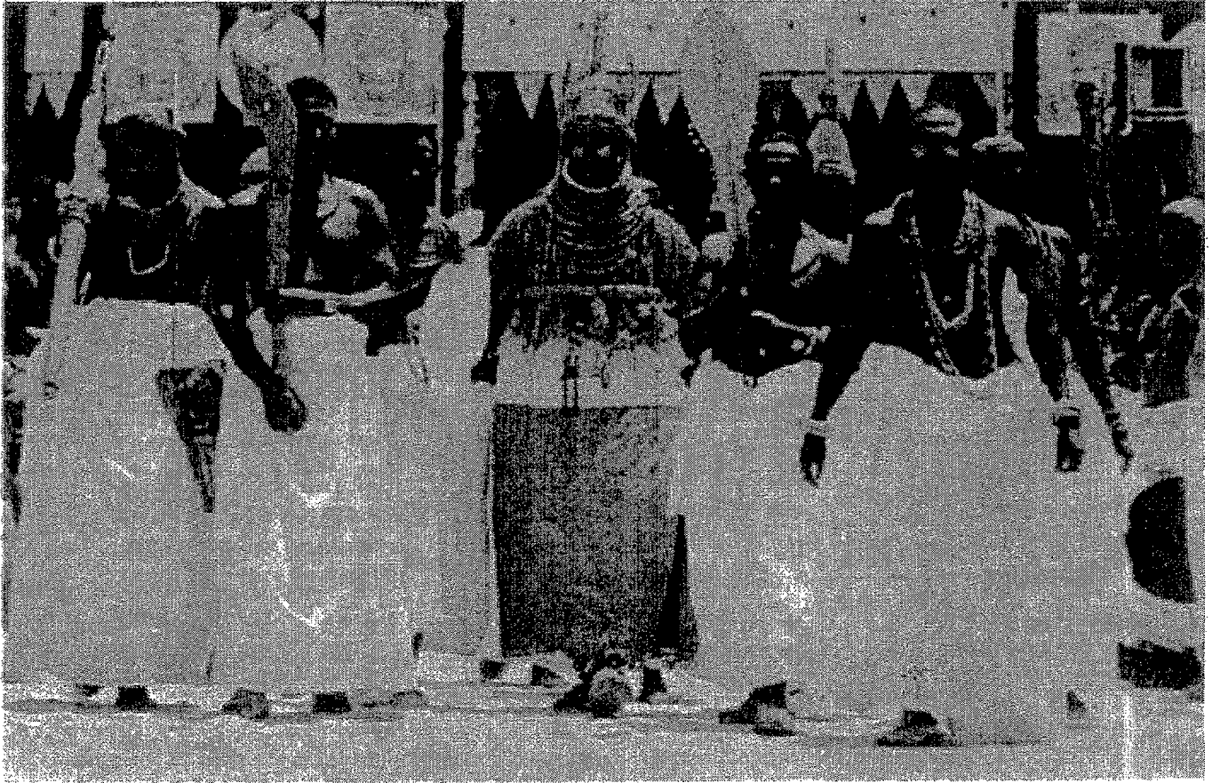
De koning van Benin: Omo 'Oba Erediauwa en traditionele volkshoofden tijdens de jaarlijkse viering van zijn troonsbestijging.