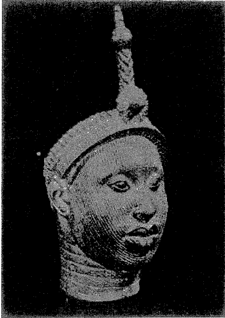
Bronzen beeld van Olokun de god van de zee en van voorspoed, fortuin. vruchtbaarheid en bescherming