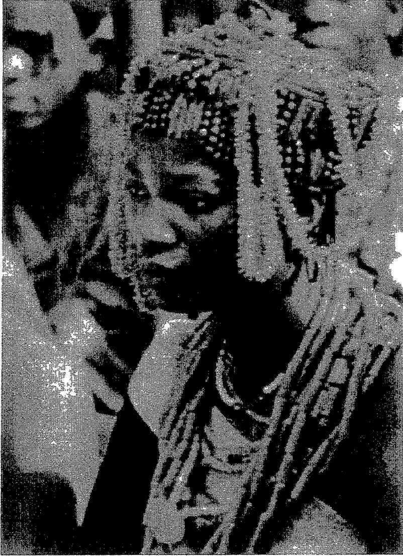
Meisje uit Benin City