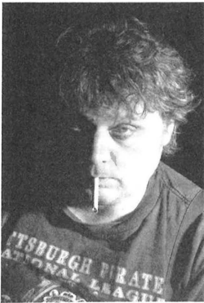
Theo van Gogh (1957–2004).

Niemand kan de toekomst voorspellen en misschien zit ik er wel helemaal naast. Maar wat De Schreeuw van Henneman ons ook lijkt toe te schreeuwen is dat we moeten beseffen dat het Europa dat Theo van