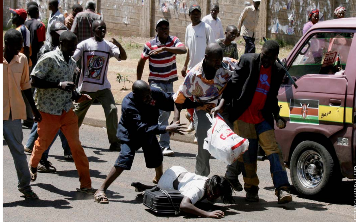
Bendeleden beroven een vrouw van de spullen die zij zelf heeft buitgemaakt tijdens de verkiezingsrellen elders in Nairobi. Het geweld eiste 300 dodelijke slachtoffers en dwong 250.000 mensen op de vlucht.

In de media worden de gewelddadigheden na de verkiezingen in Kenia afgeschilderd als een etnische strijd tussen de grootste stam, de Kikuyu van 'winnaar' Kibaki, en een 'kleine minderheidsgroep', de Luo, van oppositieleider Odinga. De situatie in multi-etnisch Kenia ligt echter veel ingewikkelder – het draait vooral om het gebrek aan perspectief en de schrijnende kloof tussen arm en rijk. En die loopt niet langs etnische lijnen.