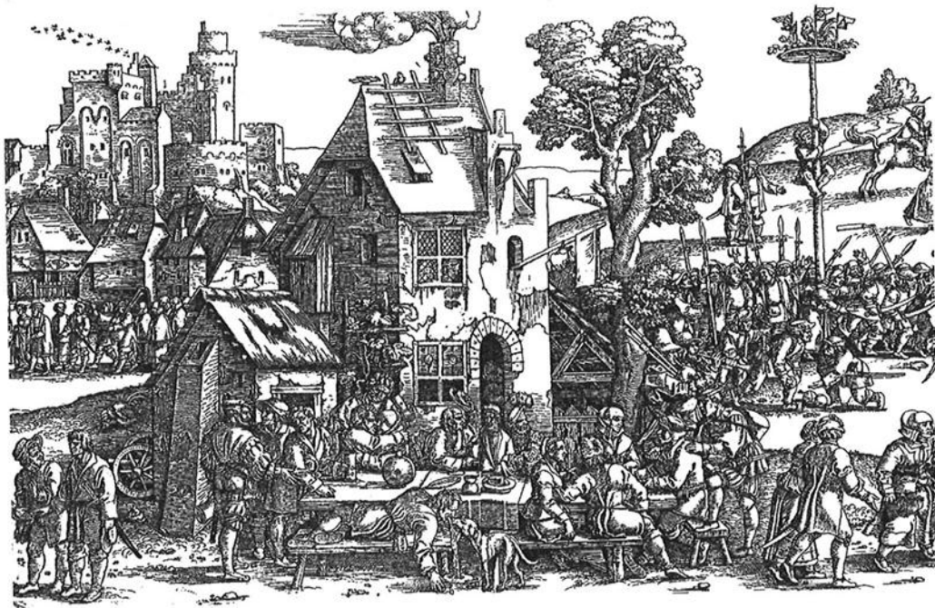
Abb. 1. Sebald Beham, Das große Kirchweihfest (Ausschnitt), 1535, Holzschnitt (nach STEWART 2002, 100–101 Abb. 3).

Bereits im 13. Jh. waren Zunftschilder, wie sie heute noch in Mitteleuropa bekannt sind, weit verbreitet (GRENSER 1889, 113). Sie dienten nicht nur als Wegweiser und Hinweis auf die Zunft, sondern thematisierten zum Teil auch die Geschichte der Stadt, die Tradition des Hauses oder des Eigentümers (LEONHARD 1977, 9; 12). Das Zunftschilder der Wirte zeigt