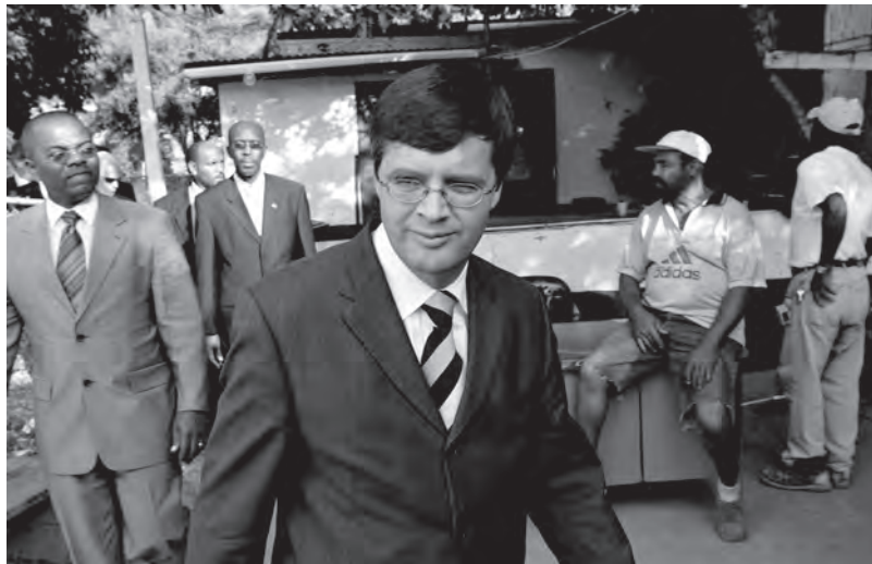
Jan Peter Balkenende op werkbezoek, Sint Maarten, 3 februari 2005. Links zijn ambtgenoot Etienne Ys.

Als niet op korte termijn werd ingestemd met het ‘Aanbod’ waren eenzijdige maatregelen van het Koninkrijk rond de openbare financiën onontkoombaar – via niet-vrijblijvende samenwerking