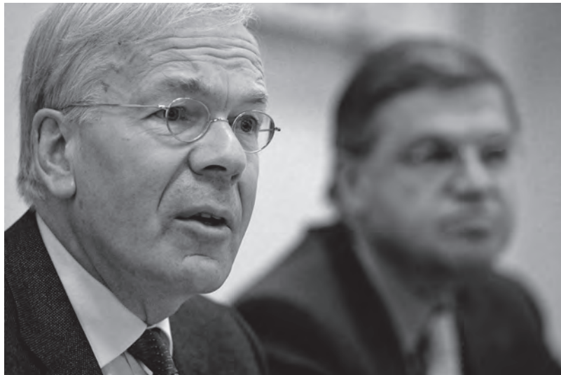
Vicepresident Herman Tjeenk Willink presenteert het jaarverslag van de Raad van State, rechts op de achtergrond Ernst Hirsch Ballin, op dat moment lid van de Raad, 26 april 2006.

Bovendien tekende zich een versterking van het rechtse blok af – waarin de PVV uitgesproken negatief was over zowel de Antillen