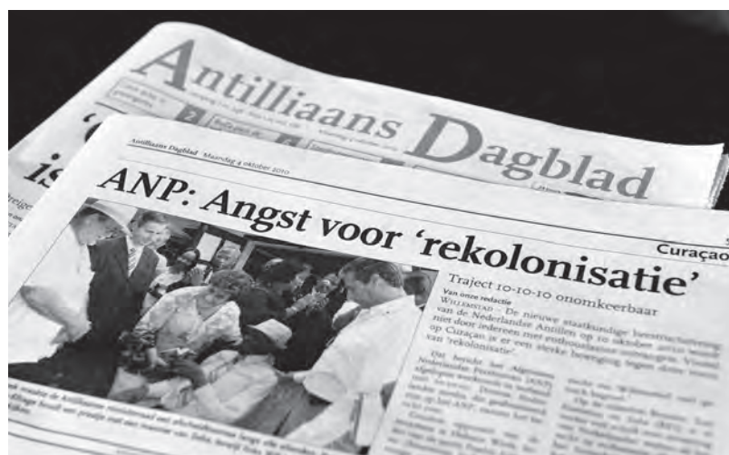
Op 4 oktober 2010, nog geen week voor de magische datum 10/10/10, kopt het Antilliaans Dagblad dat op de eilanden zorgen leven over 'rekolonisatie'.

Op de achtergrond van deze politieke processen speelden voortdurend ook electorale zorgen. Hier lijkt een duidelijk patroon zichtbaar.