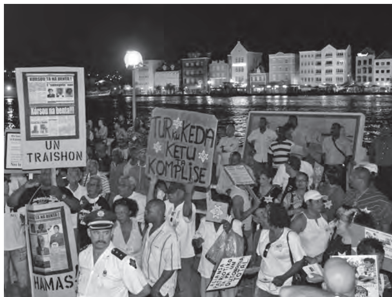
Betoging tegen ‘rekolonisatie’ door Nederland en het ‘verraad’ van de PAR tijdens de toetsings-RTC in Willemstad, 15 december 2008.

De Curaçaose afwijzing werd in Den Haag ervaren als een grote teleurstelling. Er werd echter ‘geen millimeter ruimte’ geboden om te heronderhandelen. Den Haag achtte het akkoord optimaal, volgens Nicolaï had het zelfs een ‘veel betere constructie’ opgeleverd dan de status aparte van Aruba. 2 Dat Curaçao zichzelf nu buitenspel zette, noemde de bewindsman weliswaar ‘onverantwoord’ tegenover de bevolking, maar dit hoefde geen vertraging op te leveren voor de overige eilanden. In de Kamer bevestigde Nicolaï dat de maatregelen, ook op financieel gebied, voor de K3 en Sint Maarten volgens het afgesproken schema uitgevoerd zouden worden; desnoods kon het Antilliaanse staatsverband alleen nog uit Curaçao blijven bestaan. Deze take it or leave it -houding richting Curaçao kon rekenen op de steun van de voltallige Kamer. Intussen werd Nicolaï van ambtelijke