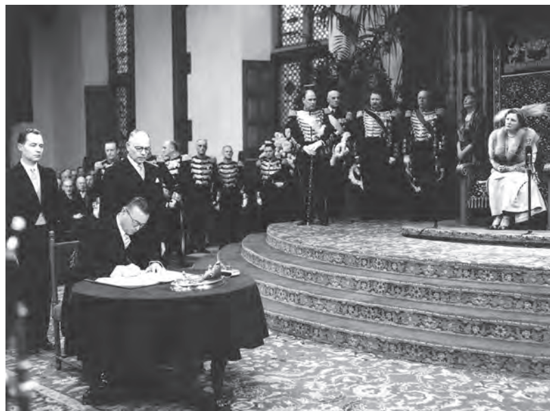
De Antilliaanse minister-president Efraïn Jonckheer ondertekent, toegekeken door koningin Juliana, het Statuut voor het Koninkrijk der Nederlanden in de Ridderzaal, Den Haag, 15 december 1954.

Wat dat laatste betreft, ging het om een drietal overwegingen. Allereerst, en aanvankelijk de grootste zorg, het besef wel verantwoordelijk te zijn voor het waarborgen van deugdelijk bestuur overzee, maar met het oog op de Caraïbische autonomie weinig speelruimte te hebben om in een vroeg stadium te voorkomen dat problemen ontstaan. Daaraan was althans in eerste instantie, met mei 1969 nog vers