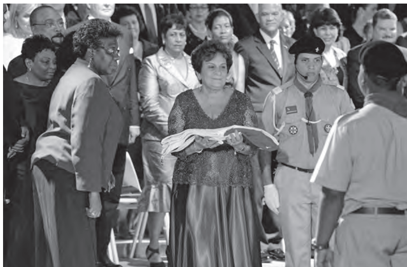
De laatste minister-president van de Nederlandse Antillen, Emily de Jongh-Elhage, neemt de vlag van de Nederlandse Antillen in ontvangst; rechts achter haar de laatste gouverneur van de Nederlandse Antillen, eerste gouverneur van Curaçao, Frits Goedgedrag; Curaçao, 9 oktober 2010.

De politieke strijd van het eilandelijk separatisme werd gevoerd met bestuurlijke argumenten, maar ook met een beroep op eilandelijke culturele eigenheid . Het eerste, ‘zakelijke’ type argument – de opgelegde, ‘koloniale’ constructie van vijf of zes eilanden bestuurd vanuit Curaçao was inefficiënt en riep voortdurend obstructie op – legde in