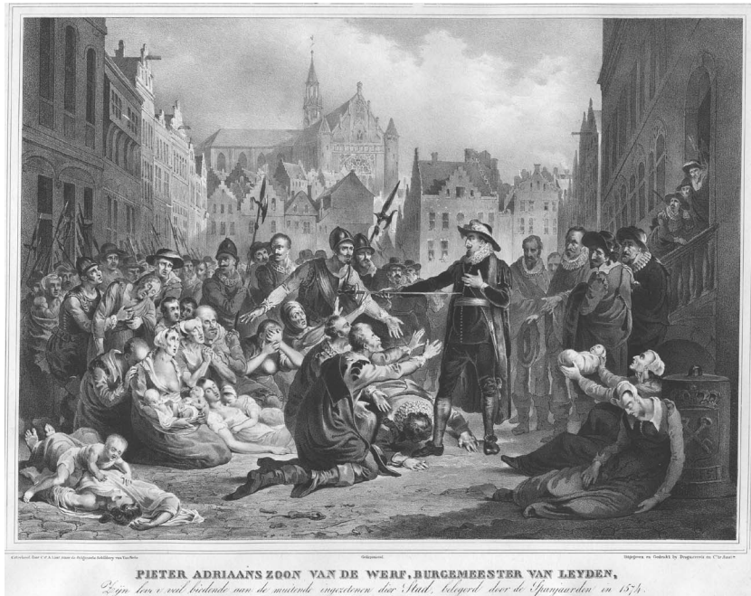
5. De zelfopoffering van burgemeester Van der Werf. Schilderij door M.I. van Bree (Stedelijk Museum De Lakenhal,)

den in Hollandt... De eerste uitgave uit 1574 maakt melding van de defaitistische houding van enkele, niet bij name genoemde regenten die tot overgave bereid waren. In de tweede uitgave is een aanvullende passage opgenomen met de beroemd geworden anekdote volgens welke Van der Werf zijn lichaam zou hebben aangeboden als voedsel voor de hongerige Leidse bevolking. De schrijver vervolgt dat de moedige en standvastige Van der Werf een goed voorbeeld is voor alle regenten in deze roerige tijd. De herziene uitgave van de Corte beschryvinghe beoogde onder meer een rehabilitatie van het stadsbestuur, in het bijzonder van Van der Werf 58 Het is dan ook niet verwonderlijk dat wel is gesuggereerd dat deze aanvulling door Van der Werf zelf is ingegeven. 59 Aangezien hij in 1576 opnieuw burgemeester was geworden, zal een opgepoetst imago hem zeker goed zijn uitgekomen. Wie er ook voor verantwoordelijk is geweest, het was een geslaagde p.r.stunt want de mythe van Van der Werfs standvastigheid en opofferingsgezindheid heeft eeuwenlang standgehouden. Wie zou zich hem nog als aarzelaar willen herinneren? In het collectieve geheugen is hij de held die geen twijfel kent.