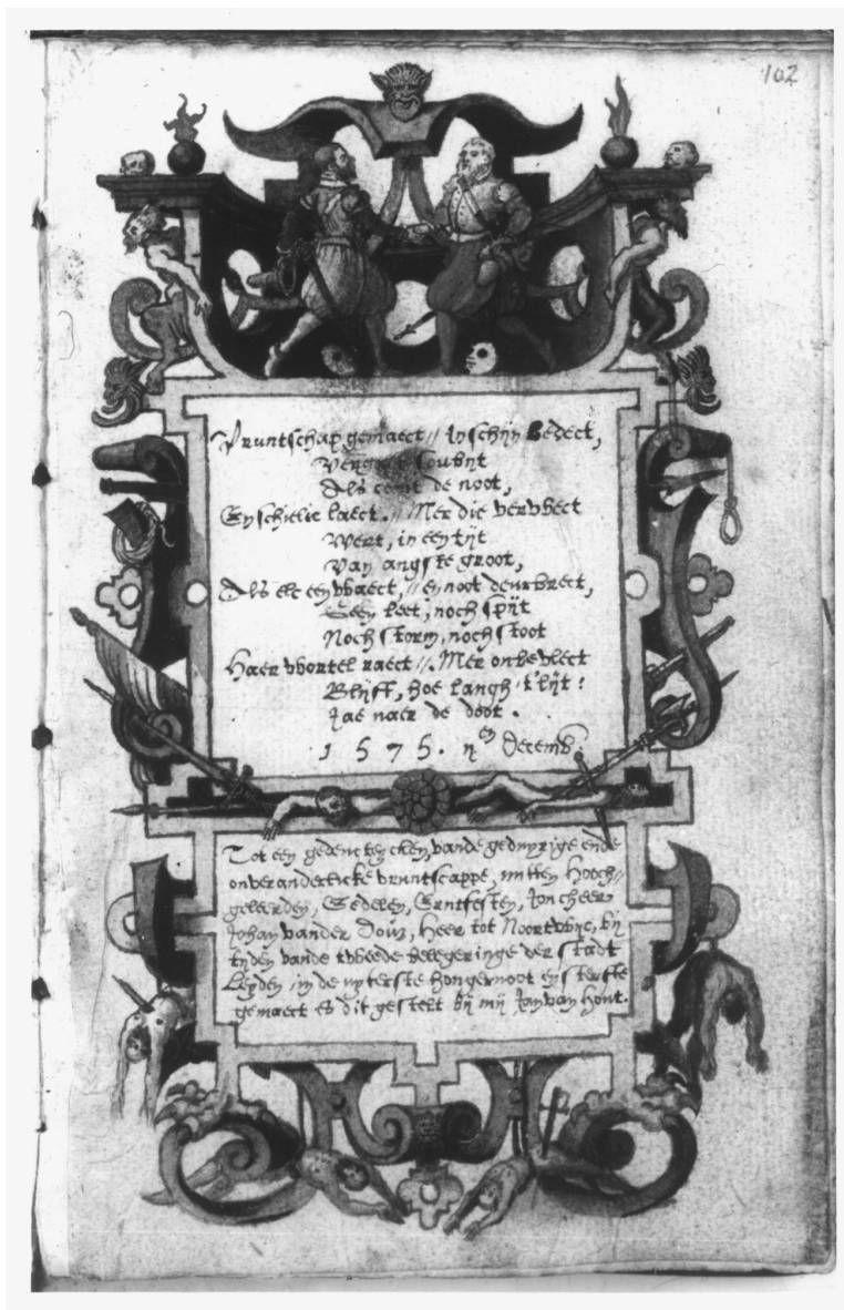
4. In zijn bijdrage aan het Liber Amicorum van Janus Dousa betuigt Jan van Hout hun vriendschap, die door de gezamenlijk doorstane ontberingen van het beleg zo sterk was dat niets en niemand er vat op kon krijgen. Evenals de tekst verwijst ook de omlijsting naar de nood en de wreedheid tijdens het beleg. Tekening.

Het is aan de kleine kliek haviken, bestaande uit Janus Dousa, Jacob van der Does en Jan van Hout, te danken geweest dat het aanknopen van onderhandelingen met de belegeraars is uitgesteld totdat het ontzet door de geuzen op handen was. De schutterij heeft daarbij een dwingende en mogelijk zelfs beslissende rol gespeeld. In een brief aan Willem van Oranje laat Dousa zich lovend over de schutters uit. Niet de stadsbestuurders maar de schutters waren het in eerste instantie geweest die Leiden aan de kant van de opstand hadden gebracht. 47 Tijdens het beleg zorgden zij voor de verdediging van de stad en hielden zij oproerige burgers onder de duim. 48 Zo konden enkele hardliners in weerwil van een weifelend stadsbestuur de verzwakte en morrende bevolking afhouden van een overgave.