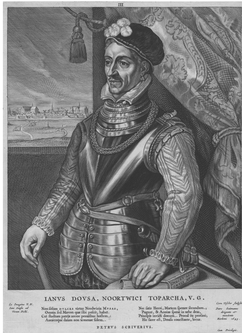
2. Jan van der Does alias Janus Dousa, kopergravure door Cornelis Visscher, 1649.