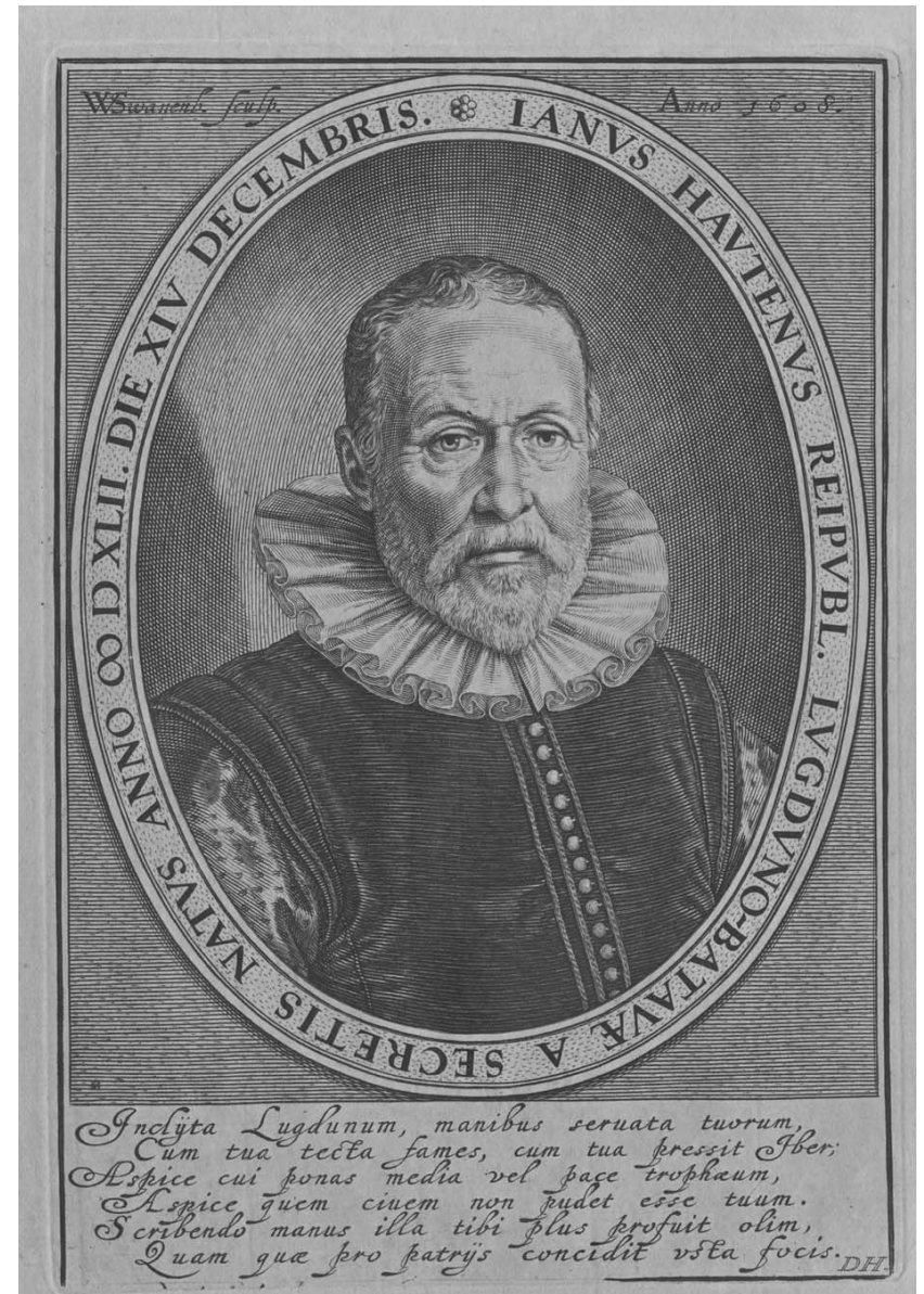
3. Jan van Hout, kopergravure door Willem Isaacsz. Swanenburgh, 1608.