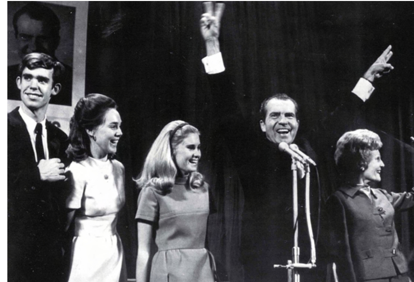
De tot president van de Verenigde Staten gekozen Richard Nixon, met zijn echtgenote Pat, dochter Julie en Tricia en schoonzoon David Eisenhower, 1969.

Ook de onthulling van de Pentagon papers had een dergelijk effect. Daaruit bleek dat vier achtereenvolgende regeringen met een beroep op de nationale veiligheid op eigen houtje de oorlog in Vietnam hadden uitgebreid, en ook operaties tegen Laos en Cambodja waren begonnen. Openlijk beled Nixon een einde te willen maken aan de oorlog in Vietnam, achter de schermen continueerde hij agressieve offensieven in allerlei nieuwe landen. De reactie van het Congres op beide onthullingen was dodelijk voor de