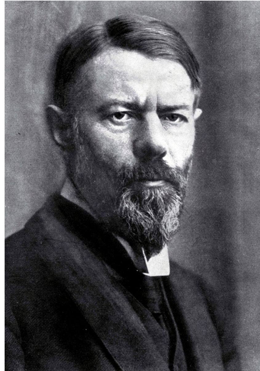
Duitse socioloog Max Weber, 1864-1920.