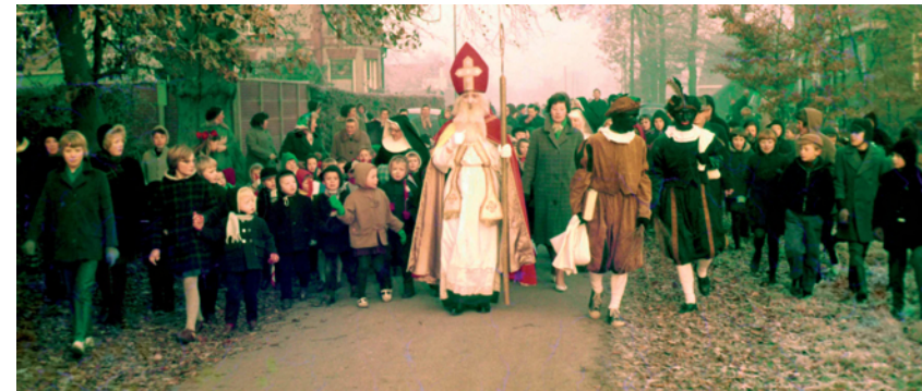
Intocht van Sinterklaas in de jaren vijftig in het Overijsselse dorpje Haarle.

Archiefonderzoek naar historische bedreigingen en naar historische praktijken van geheimhouding leert ons een lesje over verspilling van tijd, middelen en energie in de strijd tegen windmolens. Het leert ons ook dat die windmolens voor tijdgenoten wel degelijk een groot gevaar vormden. Ik wil hier niet post hoc, met de kennis van nu, een oordeel vellen over gebrek aan oordeelsvermogen van historische personen. Dat doet geen recht aan hun kennishorizon en aan de oprechte angsten voor bijvoorbeeld het Russische gevaar of voor de kernbom. Maar het laat wel zien dat óók toen al een tijdiger evaluatie van en een publieke verslaglegging over wat er dan als gevaar werd beschouwd, en wat de criteria voor uitbreiding van maatregelen of geheimhouding waren, wellicht tot meer terughoudendheid, minder hooggespannen verwachtingen, minder publieke opschudding en minder schade aan burger- en grondrechten hadden geleid.