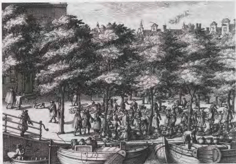
Afb. 3. De potmarkt op de Noordermarkt te Amsterdam in 1693. Gravure. Foto AA 88706. Collectie Nederlands Openluchtmuseum, Arnhem.

echter dat de schare handelaren in het voorjaar, voorzien van roggebrood, in tien tot twaalf dagen naar Nederland liep. 28 De reizigers liepen zo'n acht tot tien uur per dag.