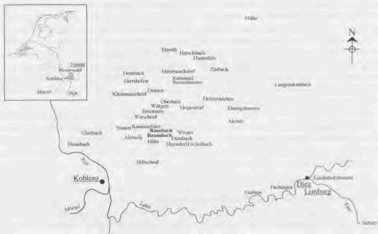
Abf. 5. Plaatsen waaruit Westerwalder aardewerkhandelaren in Nederland afkomstig waren (Koblenz en Diez Limburg zijn aangegeven ter oriëntatie) en de bronnen Geihau, Fachingen en Selten.

een jaar. In Nederland werden de papieren door de lokale politie geïveerd. Het verlopen van de papieren was op zichzelf geen grond voor uitzetting. De Vreemdelingenwet van 1849 bepaalde dat elke vreemdeling in Nederland mocht verblijven en werken zolang hij over voldoende middelen van bestaan beschikte en geen gevaar voor de openbare orde opleverde. 49 Bij het merendeel van de vreemdelingen die in de jaren vijftig van de 19e eeuw werden uitgezet, was de reden een gebrek aan middelen van bestaan. Slechts een enkeling werd uitgezet om andere redenen, zoals openbare dronkenschap.