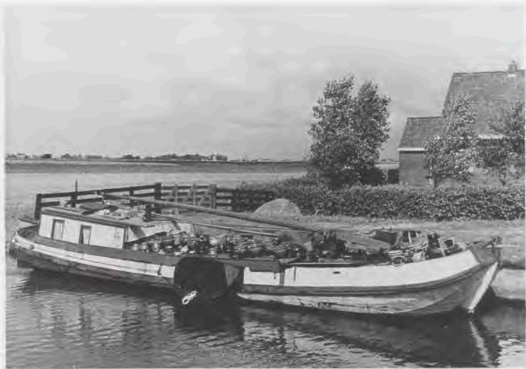
Afb. 4. Een potschip bij Workum in 1943. Tot ver in deze eeuw werd aardewerk gewoonlijk op potschepen vervoerd.

Aardewerk werd vanzelfsprekend niet alleen in het Westerveld gemaakt, maar ook op tal van plaatsen in Nederland en daarbuiten. In Delft kwam in de 17e eeuw de aardewerkindustrie tot bloei, gestimuleerd door het wegvallen van de importen uit China en Japan. In de 18e eeuw verviel deze sector echter door concurrentie uit het buitenland, vooral uit Engeland. De Delftse productie had in de 18e eeuw ook te lijden onder de toevloed van Franse en Duitse producten en de hervatte aanvoer van Oosters porselein. 33 Tekenend voor het geringe belang van de lokale nijverheid aan het begin van de 19e eeuw is dat in de boedelinventarissen van de Delftse gegoede burgerij tussen 1830 en 1850 het Delftse aardewerk totaal ontbreekt, zelfs in de keuken. 34