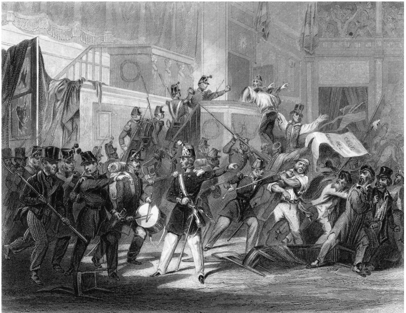
De Assemblée Nationale wordt op 15 mei bestormd door een massa demonstranten, onder aanvoering van prominente clubleiders.