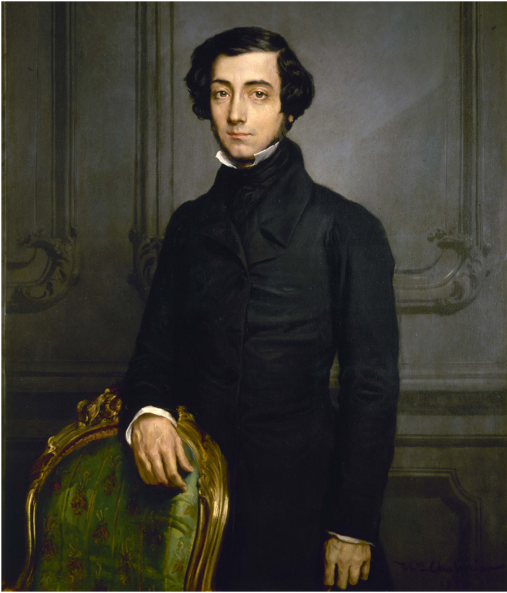
Alexis de Tocqueville beleefde als lid van het parlement de bestorming op 15 mei van nabij.

dit voorstel tussen voor- en tegenstanders, trok Huber zich gedeceerd terug. Een vergadering van ‘volslagen gekken’ wenste hij niet voor te zitten. Toch was zijn inbreng doorslaggevend en werd in elk geval besloten tot uitstel van de demonstratie naar 15 mei. Op 13 mei kwamen weliswaar nog enkele duizenden demonstranten bij elkaar, maar zij dropen al vlot af na te zijn geconfronteerd met een overmacht van de Nationale Garde. 47