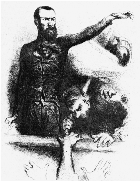
Armand Barbès probeert de Assemblée Nationale toe te spreken na de bestorming op 15 mei.

In de totale verwarring die heerste in de parlamentszaal, probeerden beurtelings Raspail, Blanqui en Barbès het woord te nemen – eerst over de Poolse kwestie, maar al gauw ook over de binnenlandse conflicten die de gemoeieren in de clubs in de voorbije twee weken op scherp hadden gezet. 52 Deze spontane en chaotische toestand, die in feite een poging was om een alternatieve ‘volksvergadering’ te houden, duurde volgens de sceptische Tocqueville twee uur voort. Totdat een verwarde en verformfaaide Huber naar voren trad. Hij ‘beklom de verhoging en plantte er een vlag met een rode muts op. [...] Tweemaal riep hij: “In naam van het volk, dat is bedrogen door zijn vertegenwoordigers, verklaar ik de Nationale Vergadering voor ontbonden!” 53 Het parlement hield nu definitief op met vergaderen, waarop de indringers hun kansen waagden en voorstellen presenteerden voor het benoemen van een nieuwe regering. Het schouwspel werd uiteindelijk beëindigd door een inval van de Nationale Garde, die de parlementariërs ontzette en de menigte naar buiten joeg.