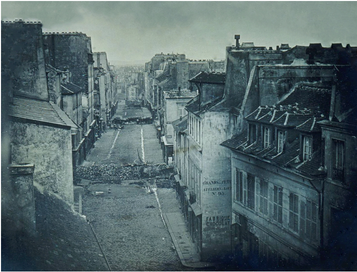
Foto van een barricade in de Rue Saint-Maur, Parijs (25 juni 1848).