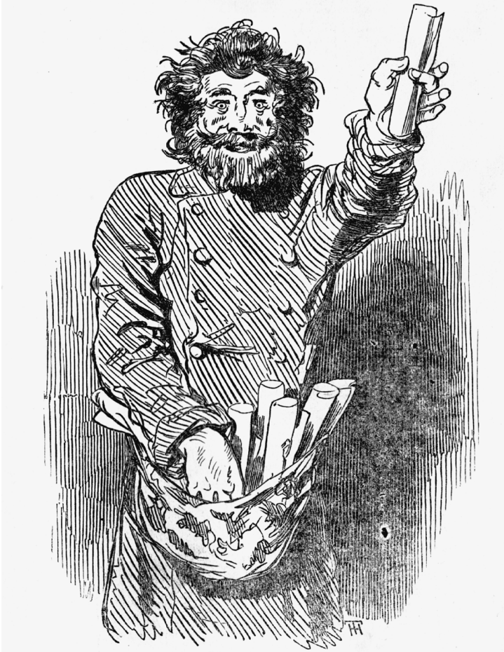
Spotprent van een anarchist die zijn ideeën aan de man brengt: 'gegarandeerd zonder regering'.

zijn collega's in de Chambre des Députés met hun neus op deze feiten. De achtergrond voor de zorgen van Tocqueville was zijn constatering dat de Franse samenleving tijdens de Julimonarchie ten diepste verdeeld was geraakt in 'twee lagen': 'in de bovenste, waar zich het gehele politieke leven van de natie moest afspelen, heersten louter lusteloosheid, onmacht, starheid en verveling. In de onderste begon het politieke leven juist merkbaar te worden aan koortsige en onregelmatige symptomen, die de opmerkelijke waarnemer moeilijk konden ontgaan.' 28