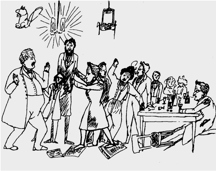
Karikatuur geschetst door Friedrich Engels zelf, van het genootschap der 'Freien', waar hij met Karl Marx deel van uitmaakte.

De politieke satire in Berlijn kreeg in 1847 een impuls met de oprichting van de krant Berliner Charivari . Een veelzeggende naam: 'charivari', een ander woord voor ketelmuziek, was een traditie van spottend volksvermaak die stamde uit de Middeleeuwen. Het gebruik was een uitlaatklep voor volkswoede en een wapen tegen (morele) wantoestanden – of simpelweg tegen het doorbreken van de sociale codes. Ook in de jaren 1840 nog riskeerden Berlijners die van sociale normen afweken het mikpunt te worden van verbaal en fysiek onterende aanvallen in de traditie van de Katzenjammer . 51 Het blad was meer dan alleen 'gedrukte ketelmuziek': net als bij de narrenvereniging dienden spot en volksvermaak voor de krant als camouflage om het gezag te kunnen bekritisieren. 52 Direct na de revolutie van 1848 zou de Charivari concurrentie krijgen van enkele nieuwe kranten en talloze satirische vlugschriften en affiches.