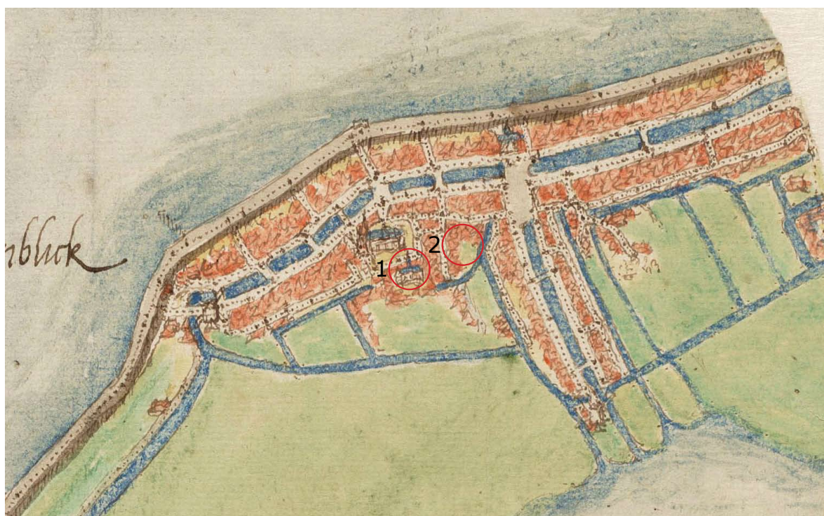
3-6 Stadsplattegrond van Medemblik van Jacob van Deventer uit circa 1560. Even ten zuiden van de kerk van Medemblik is de kapel van het Mariaconvent getekend. De kapel van het Catharinaconvent is op deze kaart niet te zien.