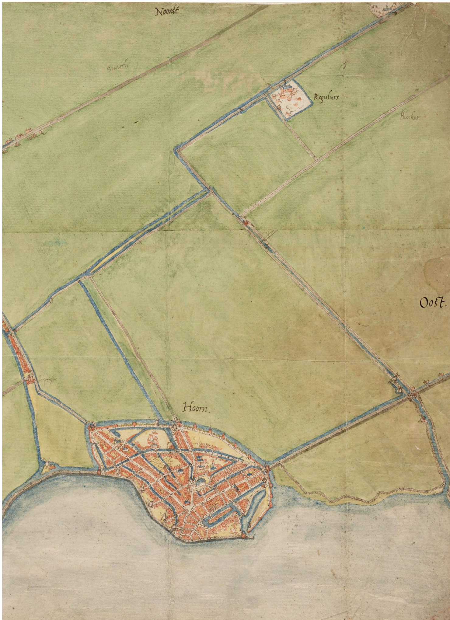
3-1 Plattegrond van Hoorn met het buitengebied, gemaakt door Jacob van Deventer ca. 1560. In de stad Hoorn zijn de kapellen van de verschillende kloosters goed te herkennen aan hun blauwe leien daken. Even ten noorden van Hoorn, op het grondgebied van Westerblokker, ligt het grote kloostercomplex Nieuwlicht en daar weer boven is nog net zichtbaar klooster Bethlehem. Van Deventer heeft zich hier vergist: het klooster staat aan de verkeerde kant van de weg getekend.