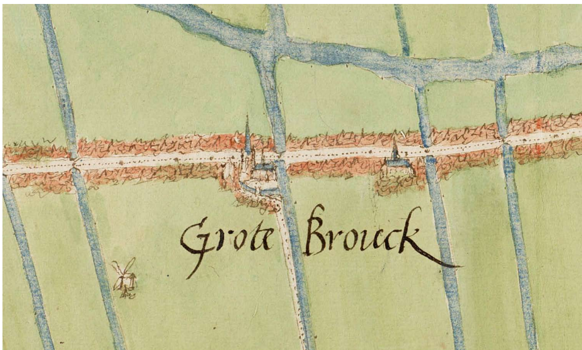
3-7 Detail van de stadsplattegrond van Grootebroek van Jacob van Deventer uit circa 1560. Even ten oosten van de kerk van Grootebroek is ten zuiden van de Streekweg de kapel van het St. Elisabethconvent te zien.

den sijn, en hun broodt met boekbinden of parkament maken winnen, sij souden alleenlijk tweemaal des weeks, soo 't noodt was, om broodt gaan'. Verder staat vermeld: 'in pesttijden souden sij de kranken, die het begeerden, bijstaan, en de dooden ter aarde draegen'. De broeders kregen een stuk land met de naam 'kosters bon' toegewezen, dat behoorde tot de kosterij van de Westerkerk. Brandt brengt de stichting vervolgens onterecht in verband met het latere Augustijnenklooster, dat niet bij de Westerkerk, maar bij de Zuiderkerk stond. Op basis van de tekst van Brandt heeft Goudriaan het klooster uit 1458 ingedeeld bij de cellebroeders, die de derde regel van Franciscus volgden en aan ziekenzorg deden. 72 Vooralsnog duikt dit klooster nergens anders in de bronnen op, zodat moet worden aangenomen dat het geen lang leven beschoren is geweest.