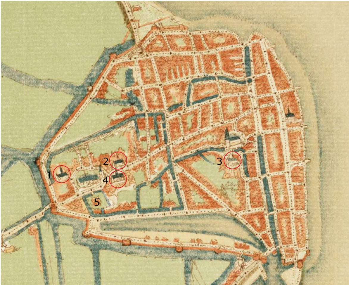
3-5 Stadsplattegrond van Enkhuizen van Jacob van Deventer uit circa 1560. De kapellen van de verschillende religieuze gemeenschappen zijn omcirkeld.

Nieuw gestichte religieuze vrouwengemeenschappen in de 15 de eeuw volgden meteen vanaf het begin de derde regel. Dit gold voor het Ceciliaconvent (1441) in Enkhuizen. Van enkele conventen is niet bekend wanneer ze zijn gesticht maar valt wel te achterhalen dat ze op zeker moment tertiariissenconventen waren: het Catharinaconvent (voor 1421) in Schagen, het Catharinaconvent (voor 1436) in