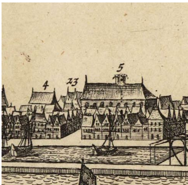
3-9 Uitsnede van een gravure met stadsgezicht van Hoorn vanaf zee, uit ca. 1650. In het midden (nr. 5) de kapel van Pietersdal. Links (nr. 4) de kapel van het Claraconvent.

nen bekend, maar toch is het maar recent dat alle bronnen met betrekking tot de stichting op een rij zijn gezet. 148 In 1496 werd het eerste initiatief genomen, een petitie werd ingediend en in 1498 verkregen de broeders pauselijke toestemming. 149 De broeders waren vanaf dat moment augustijner eremieten, een bedelorde (mendicanten) die de regel van Augustinus volgde. De observatiebeweging binnen de augustijnenorde leidde tot een splitsing in observanten en conventuelen. De eerste groep wilde terug naar het oorspronkelijke eremietenleven. De tweede groep wilde het gevestigde kloosterleven handhaven. Binnen de observanten waren weer verschillende stromingen met eigen congregaties: diverse Italiaanse, een Spaanse en een Saksische. De Saksische congregatie was in 1438 opgericht en had veel invloed in Duitsland en de Lage Landen. In de periode 1489-1499 werden vanuit deze congregatie