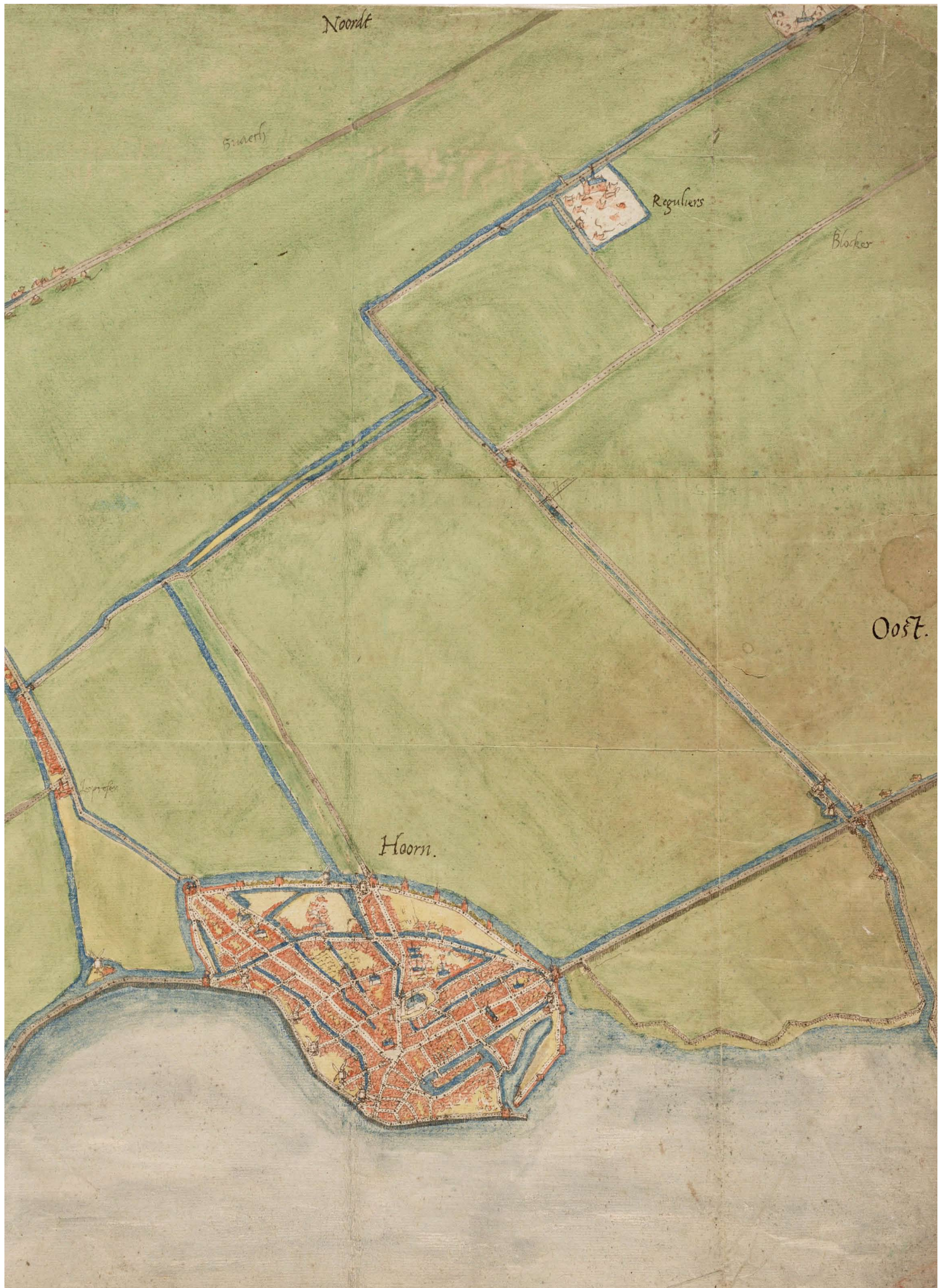
3-1 Plattegrond van Hoorn met het buitengebied, gemaakt door Jacob van Deventer ca. 1560. In de stad Hoorn zijn de kapellen van de verschillende kloosters goed te herkennen aan hun blauwe leien daken. Even ten noorden van Hoorn, op het grondgebied van Westerblokker, ligt het grote kloostercomplex Nieuwlicht en daar weer boven is nog net zichtbaar klooster Bethlehem. Van Deventer heeft zich hier vergist: het klooster staat aan de verkeerde kant van de weg getekend.