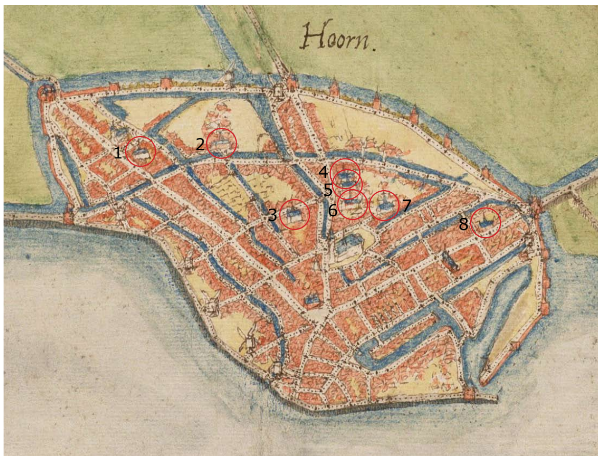
3-4 Stadsplattegrond van Hoorn van Jacob van Deventer uit circa 1560. De kapellen van de verschillende religieuze gemeenschappen zijn omcirkeld.

Niet lang na het Ceciliaconvent maakten in willekeurige volgorde het Agnesconvent, het Catharinaconvent en het Gertrudisconvent de overstap naar de derde regel onder het Kapittel van Utrecht. Deze religieuze gemeenschappen lagen alle in Hoorn. In 1409 verleende de proost van West-Friesland de kerkelijke vrijheid ( libertas ecclesiastica ) aan deze drie conventen en aan het Ceciliaconvent. Uit de akte blijkt dat deze gemeenschappen reeds de derde regel volgden en onder het Kapittel van Utrecht vielen. De aansluiting bij het kapittel zal niet lang voor 1409 hebben plaatsgevonden. Het Mariaconvent volgde in 1413. 66 Daarmee kwam het aantal derde-ordeconventen in Hoorn op vijf.