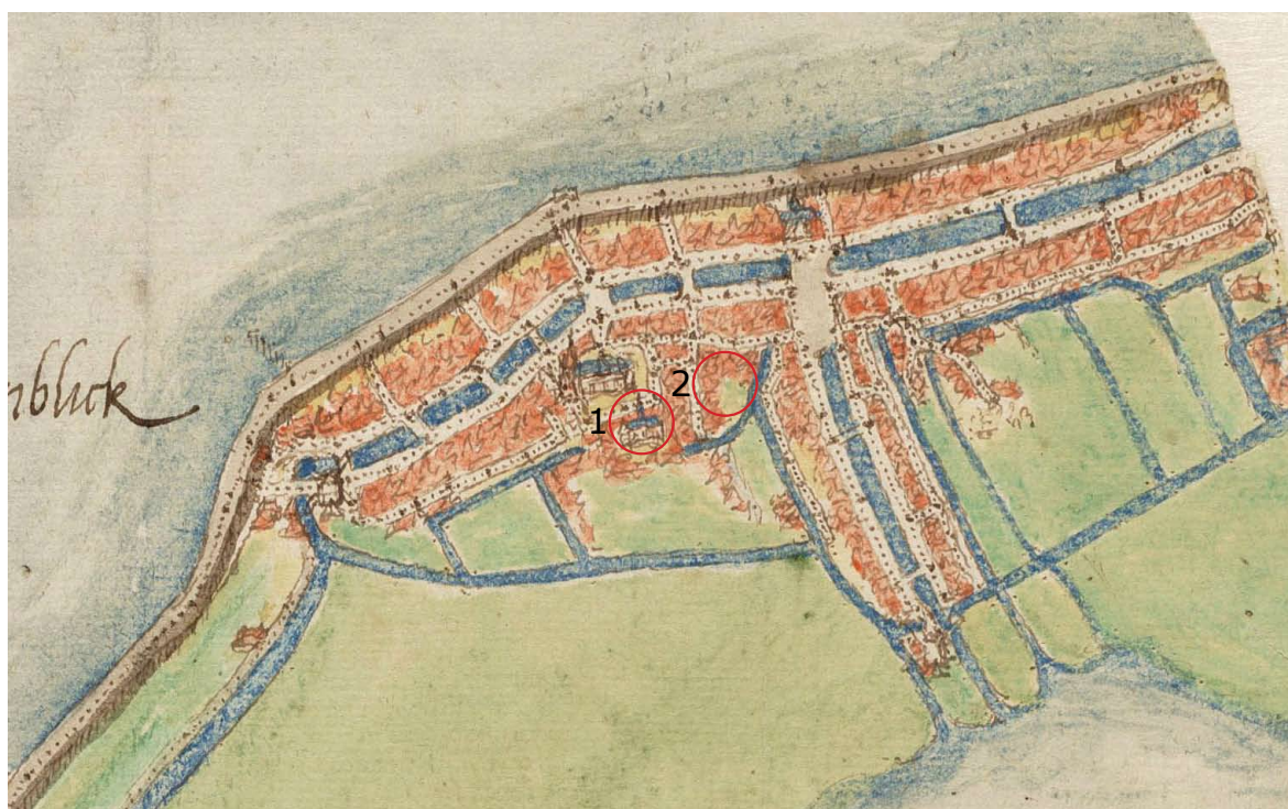
3-6 Stadsplattegrond van Medemblik van Jacob van Deventer uit circa 1560. Even ten zuiden van de kerk van Medemblik is de kapel van het Mariaconvent getekend. De kapel van het Catharinaconvent is op deze kaart niet te zien.