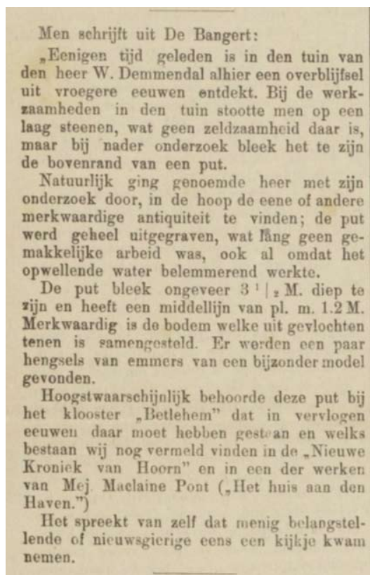
2-7 Krantenartikelje uit de Nieuwe Hoornsche Courant van 2 september 1903 waarin melding wordt gemaakt van de vondst van een waterput van klooster Bethlehem.