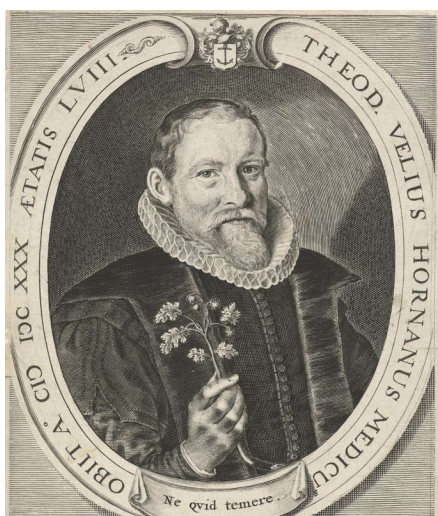
2-2 Portret van Velius. Kopergravure gemaakt naar een schilderij uit 1613.

De eerste persoon die na 1573 over het klooster schreef, was de Hoornse arts en geschiedschrijver Theodorus Velius (1572-1630). Hij was geboren in het jaar dat Hoorn de kant van de Prins van Oranje koos en de kloosters met al hun goederen door de stad in beslag werden genomen. Het was een roerig jaar, zoals we in het vervolg van dit boek nog zullen zien. Velius groeide op met de verhalen van zijn tijdgenoten, las oude geschriften over de geschiedenis van de stad en dook de stadsarchieven in. Hij verwerkte alle informatie tot een stadskroniek waarvan de eerste druk in 1605 verscheen. Bij het jaar 1475 schreef hij over de stichting van het klooster en bij het jaar 1499 over de bouw van de kapel. 9