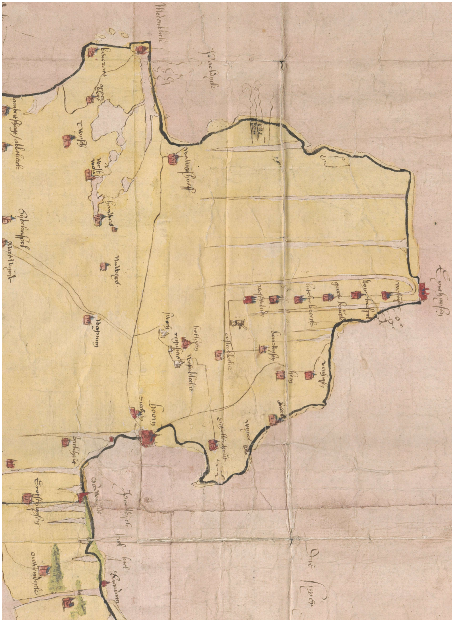
2-1 Detail van een manuscriptkaart van Noord-Holland benoorden het IJ uit ca. 1530. Dit is de oudst overgeleverde kaart van dit gebied. Even ten noorden van Hoorn zijn de dorpen Zwaag (Swach) en Westerblokker (Westerblokker) afgebeeld. Tussen beide plaatsen in, liggen de kloosters Nieuwlicht (reguliers) en Bethlehem (betleem).