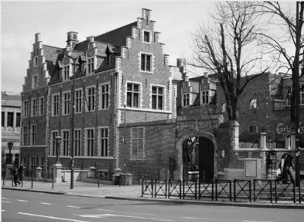
Filips van Kleef en Willem van Oranje, 'buren' op de Coudenberg te Brussel: boven het paleis van Ravenstein en onder het enige restant van het paleis van Nassau (de Sint-Joriskapel)