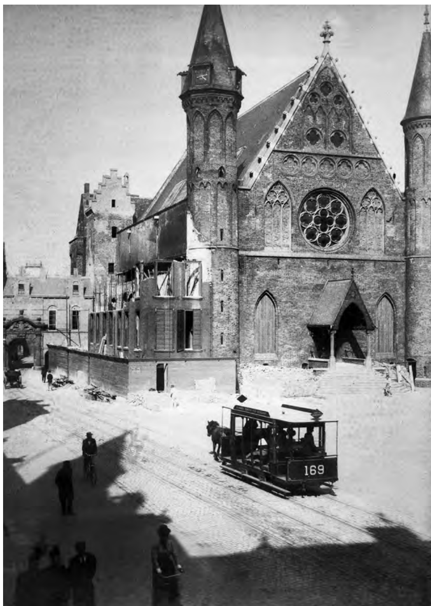
Blik op de gerestaureerde Ridderzaal met op de voorgrond een paardentram. Foto van een onbekende fotograaf, 1901 (collectie Rijksdienst voor Cultureel Erfgoed)