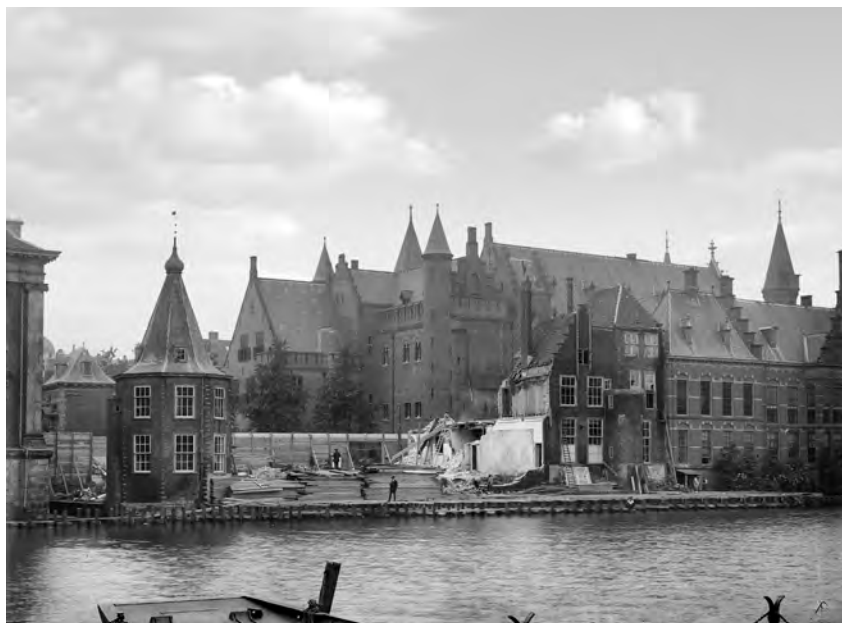
Het ministerie van Binnenlandse Zaken gedurende de 'herstelwerkzaamheden' in 1913. Foto van A. Mulder, 1913 (collectie Rijksdienst voor Cultureel Erfgoed)

openheid voerden voortaan de boventoon, terwijl de talrijke zuilen, de allegorische decoraties en de indrukwekkende glazen overkapping het geheel een statig aanzien gaven. 83