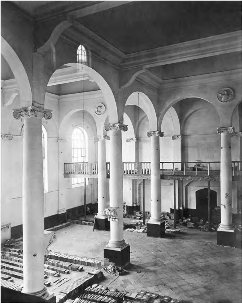
Het interieur van de Hofkapel voor de afbraak van het kerkgebouw in 1879. Foto van een onbekende fotograaf, 1879 (collectie Rijksdienst voor Cultureel Erfgoed)

functie als gebedshuis verliezen, tevens zou het volledige interieur van de kapel moeten verdwijnen. Mocht Waterstaat het pand willen betrekken, dan was het immers noodzakelijk dat kerkbanken, kansel en orgel plaats zouden maken voor functionele en modern ingerichte kantoorruimten.