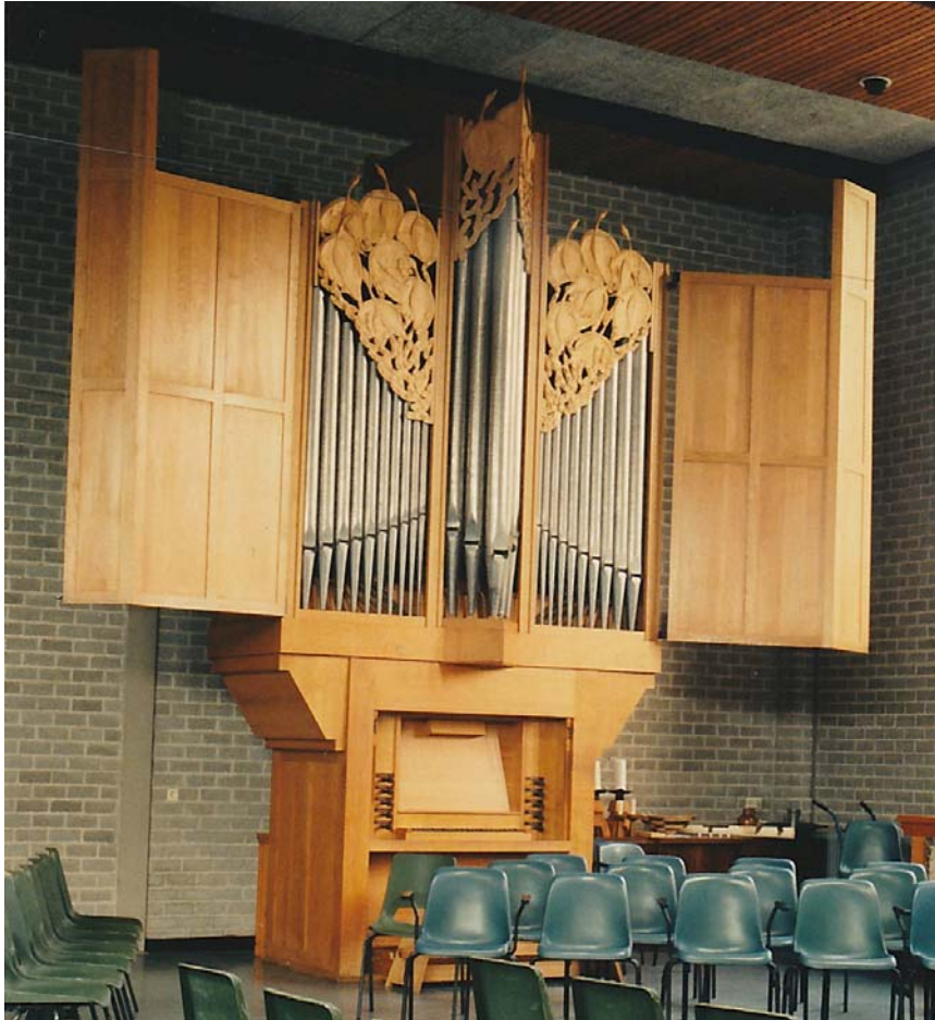
Figuur V.4 Het orgel van het vroegere kerkgebouw De Wingerd te Groningen, 1998.

gediend'. 583 Opvallend is dat de Hervormde Orgelcommissie haar rol als adviseur niet heeft opgeëist, mogelijk was dat een gevolg van de wijze van financiering. De bouwkosten rustten immers niet op de kerkelijke begroting.