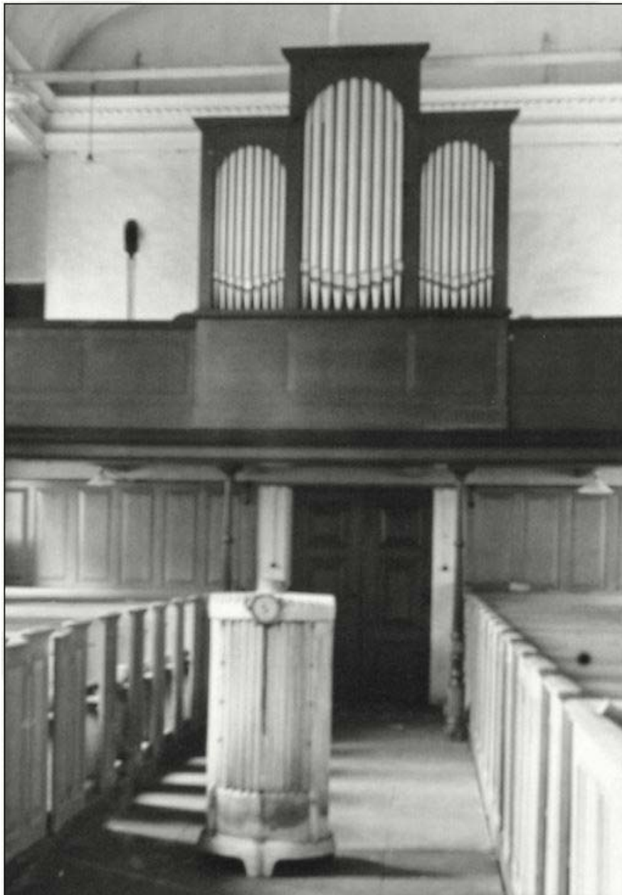
Figuur V.1 Het vroegere orgel van de Torenkerk te Winsum, 1961.