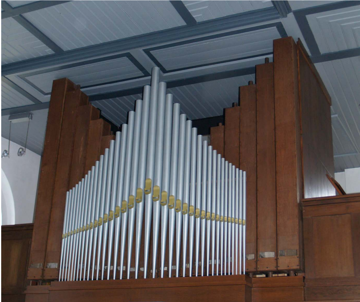
Figuur V.2 Het orgel van de voormalige Hervormde kerk te Engelbert, 5 oktober 2013.

doet mij veel genoegen dat Engelbert goed voldoet. Ik wacht nog op de laatste betaling, groot f 100,- zoo gauw ik deze ontvangen heb, hoort u dit wel van mij'. 444 Op 3 december kon Flentrop melden dat de laatste termijn ontvangen was. Kennelijk was er in Engelbert een kleine storing geweest, want hij schreef verder: 'is het plakken van de soepele verbinding tusschen motor en windkanaal goed geslaagd? Gaarne zou ik van U een getuigschrift, of zoo mogelijk een eenigszins uitgebreid rapport over dit orgel ontvangen'.