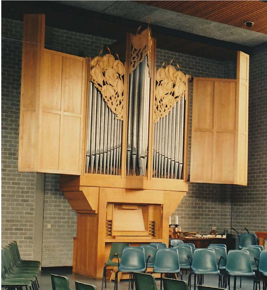
Figuur V.4 Het orgel van het vroegere kerkgebouw De Wingerd te Groningen, 1998.

gediend'. 583 Opvallend is dat de Hervormde Orgelcommissie haar rol als adviseur niet heeft opgeëist, mogelijk was dat een gevolg van de wijze van financiering. De bouwkosten rustten immers niet op de kerkelijke begroting.