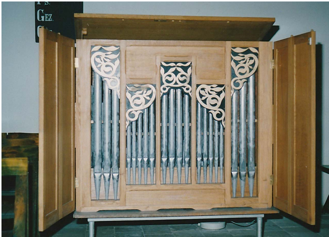
Figuur V.3 Het noodorgel van de voormalige Hervormde kerk te Garnwerd, op de foto opgesteld in de voormalige Hervormde kerk te Leegkerk, 18 oktober 1993.

Een enkele keer werd dit orgel ook in de Der Aa-kerk bij concerten gebruikt. Orgelhersteller Vos plaatste het daar dan en bracht het na afloop weer terug naar Doldersum. 588 Pas na het overlijden van zijn vrouw liet Van Meurs het kistorgel in Groningen in zijn huis aan de Prinsesseweg plaatsen. Dit orgel bevindt zich thans in particulier bezit in Wolvega.