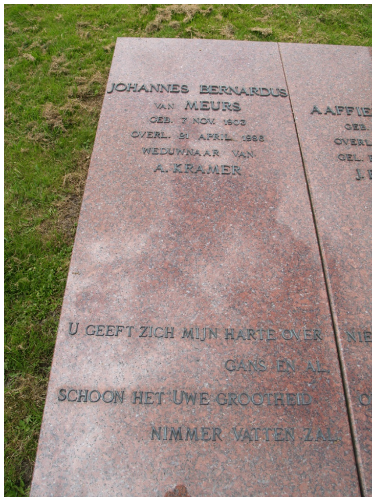
Figuur I.2 Het graf van Van Meurs op het kerkhof van Dorkwerd, 15 augustus 2010.

[...] iemand [...] die niet heeft willen schitteren als virtuoos op het concertpodium, noch op goedkope manier zijn luisteraars wilde behagen, maar die met gestage werkkraft, geduld en grote liefde velen op het goede spoor van de echte kerkmuziek heeft gezet. Als zodanig was hij [...] in eenvoud één van de allergrootsten. 23