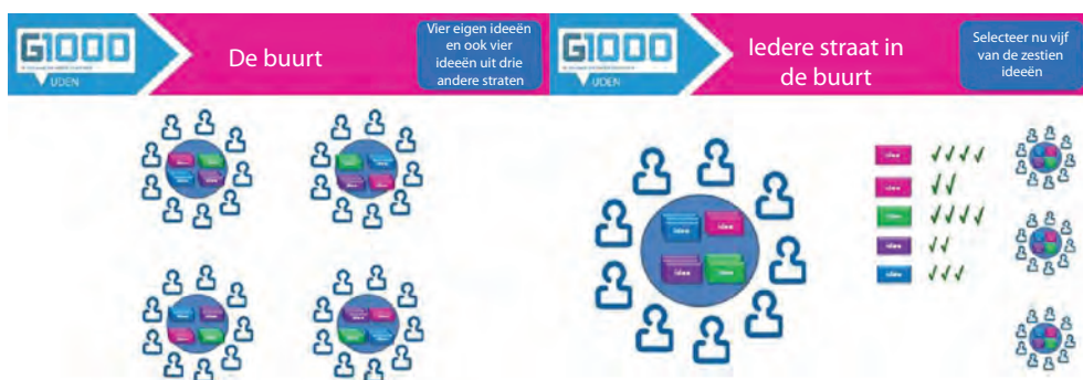
Figuur 2.3 Van straat naar buurt