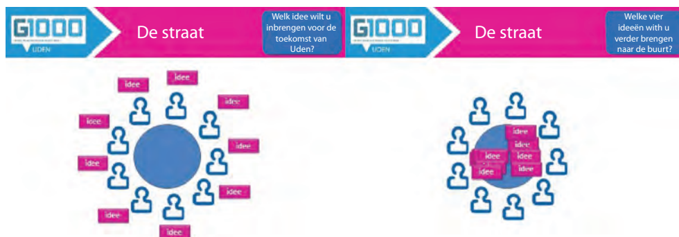
Figuur 2.2 Van idee naar straat