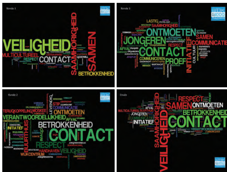
Figuur 6.1 Word clouds van de gespreksrondes

Tijdens de pauze, waarin de deelnemers wat drinken en eten, wordt door vrijwilligers van de organisatie de laatste hand gelegd aan de verwerking van de post-its. De woorden zijn verwerkt in een word cloud per ronde en een gecombineerde versie van de verschillende rondes (zie figuur 6.1). Na de pauze geeft Van Dijk aan dat het de bedoeling is dat iedere tafel een populair thema uit de finale versie van de word cloud adopteert. Daarna kan iedereen het onderwerp van interesse opzoeken en