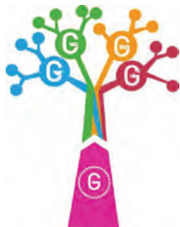
Figuur 2.1 Logo G1000 Uden

De eerste stap in de eigen ontwikkeling was een betere inbedding van de G1000 in de plaatselijke politiek, 'een betere link met de politieke wereld' (website G1000 Uden). In de (oudere) nieuwsberichten over de G1000 staat daarom met regelmaat dat de raad serieuze voorstellen zal overnemen of iets in die trant. Een dergelijke intentie heerste ook onder de raadsleden, die immers zelf met het idee van een G1000 waren gekomen. Tegelijkertijd nam de raad steeds meer afstand tot de feitelijke organisatie van de G1000. Het was immers wel de bedoeling dat de G1000 een evenement van de leefwereld zou zijn en niet van de systeemwereld. De tweede stap was een verschuiving van de focus op 1000 Udenaren die samen de Agenda voor Uden zouden vaststellen, naar duizenden ideeën voor Uden. Deelnemers mochten ook ideeën van anderen meebrengen.