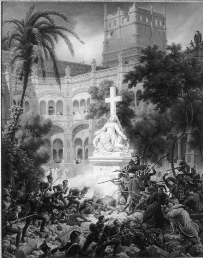
Afb. 2: L.F. Lejeune, ‘Anval op het klooster van San Engracia, Saragossa, 8 februari 1809’, 1827, olieverf op doek, collectie Musée national du château de Versailles.

maakte zich zorgen over iets, waar zijn voorgangers twintig jaar eerder geen woord aan hadden vuilgemaakt: de samenstelling van de troep. Napoleon had vele buitenlandse bondgenoten, maar die vochten in de meeste gevallen in eigen contingenten. In het Hollandse geval werden de voormalige Hollandse gebieden echter zelfstandige departementen en die departementen moesten hun ‘eigen’ regimenten vormen.