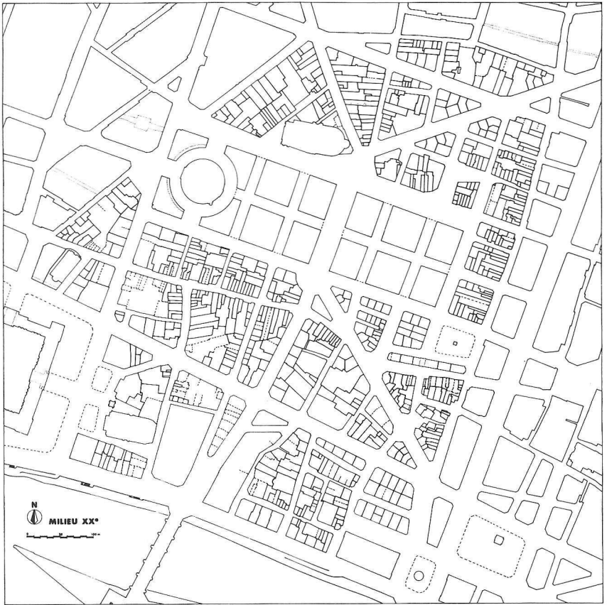
PI. 17. — ÉVOLUTION DU TISSU PARCELLAIRE DU QUARTIER DES HALLES : ÉTAT AU MILIEU DU XX e SIÈCLE

Carte établie d'après la documentation cartographique — assimilable à une documentation cadastrale — conservée à la Préfecture de Paris. Edition 1937, corrigée jusqu'en 1968.