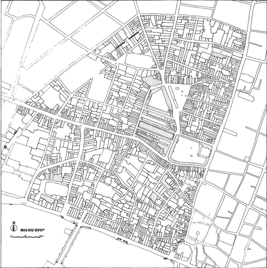
PI. 11. — ÉVOLUTION DU TISSU PARCELLAIRE DU QUARTIER DES HALLES : ÉTAT AU MILIEU DU XVII E SIÈCLE

Carte établie d'après Arch. Nat. S e 1261-1263, Censier de l'Évêché pour 1613-1623, et KK 1016, 1020, 1025, 1032-1034, 1036, Taxe des boues et des lanternes, vers 1640. Les conventions graphiques sont expliquées dans la légende de la carte n o 7.