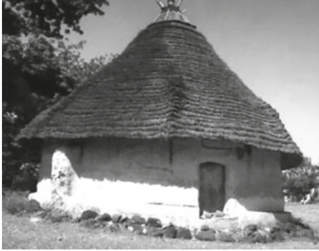
Het Kamabolon-heiligdom in Kangaba (foto Jan Jansen, 1992)

Guinée zijn bijvoorbeeld Fadama en Nyagassola, beide in Noordwest Guinée, plaatsen die beroemd zijn om hun vertellers. In Mali zijn dit Kita en Kela. 52