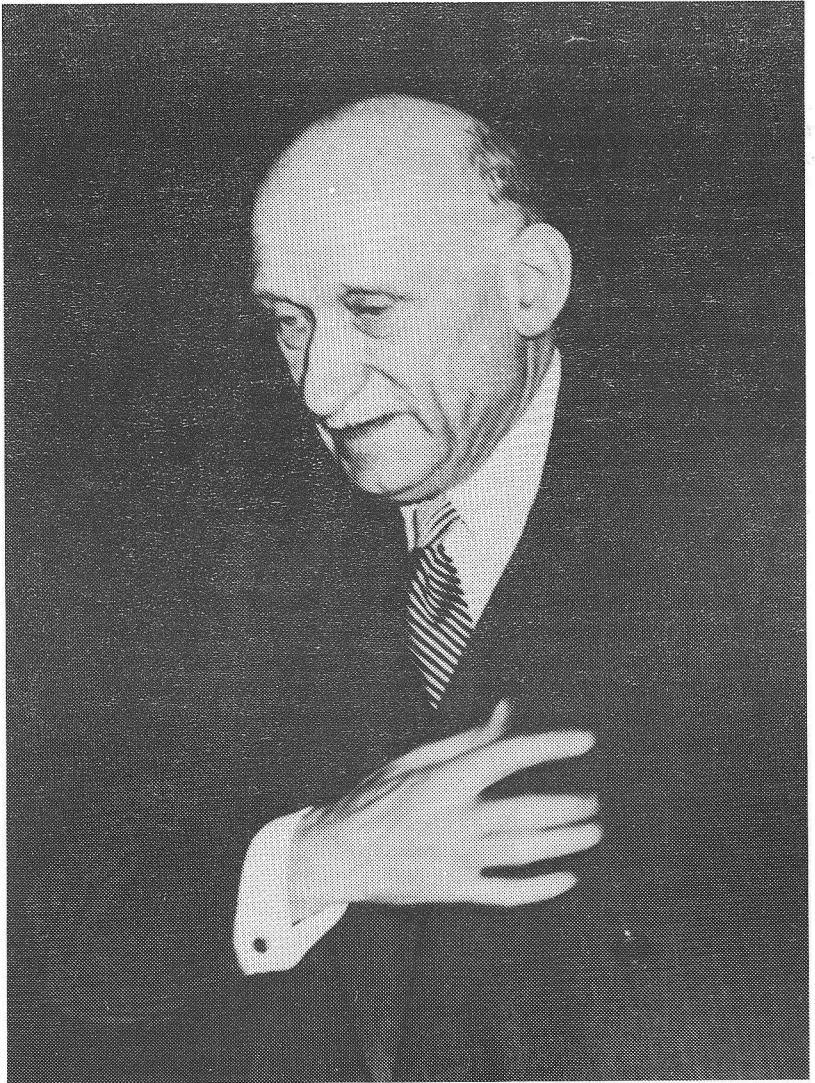
De Franse minister van Buitenlandse Zaken Robert Schuman