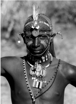
Figuur 1 Samburu krijger uit het noorden van Kenia

De huid vormt de grens tussen het lichaam en de omgeving en het is het grootste orgaan. Het is een zeer belangrijk orgaan, omdat de huid er vooral op is gericht om allerlei stoffen buiten het lichaam te houden, maar ook stoffen zoals water in het lichaam vast te houden om te voorkomen dat we uitdrogen. Zonder de huid zouden we ons vandaag niet in deze zaal bevinden en zouden we er bovendien ook niet erg aantrekkelijk uitzien. Met andere woorden de huid heeft ook een sterk esthetische functie en wordt in veel culturen gebruikt om zich een unieke uitstraling te verwerven. Een mooi voorbeeld vinden we terug in figuur 1, waar een Samburu krijger uit het noorden van Kenia z'n onoverwinnelijkheid en trots met rode klei op z'n gezicht benadrukt. Hij is klaar om op jacht te gaan. Maar de huid kan ook een afspiegeling zijn van het harde leven dat sommige volken leiden, zoals weergegeven in figuur 2, waarin een Sri-Lankaanse vrouw afgebeeld staat. De rimpels in haar gezicht stralen ouderdom en breekbaarheid uit. De rode stip op haar voorhoofd verraadt onmiddellijk haar godsdienst. Een derde voorbeeld is huidversiering met littekens. In het zuiden van Soedan kan men aan het littekenpatroon herkennen van welke etnische groep een persoon afkomstig is(3). Ook in onze eigen cultuur maken we hier gebruik van. Om er stoer uit te zien en op te vallen brachten Duitse studenten voor de 1ste WO met hun sabels tekens in hun gezicht aan.