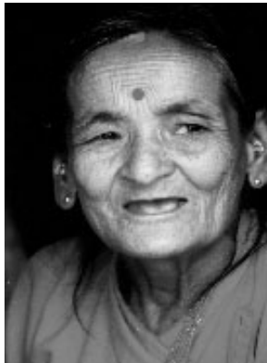
Figuur 2 Sri-Lankaanse vrouw

Zoals gezegd, de huid is ontworpen om stoffen buiten het lichaam te houden. De barrièrefunctie van de huid bevindt zich voornamelijk in het bovenste laagje van de huid, de zogenaamde hoornlaag(4). Dit is een heel dun transparant laagje, dat na een overdosis aan zonlicht ongeveer een week later grotendeels afschilfert. U hebt dit vervellen allen waarschijnlijk wel eens ervaren. De hoornlaag bestaat uit dode cellen