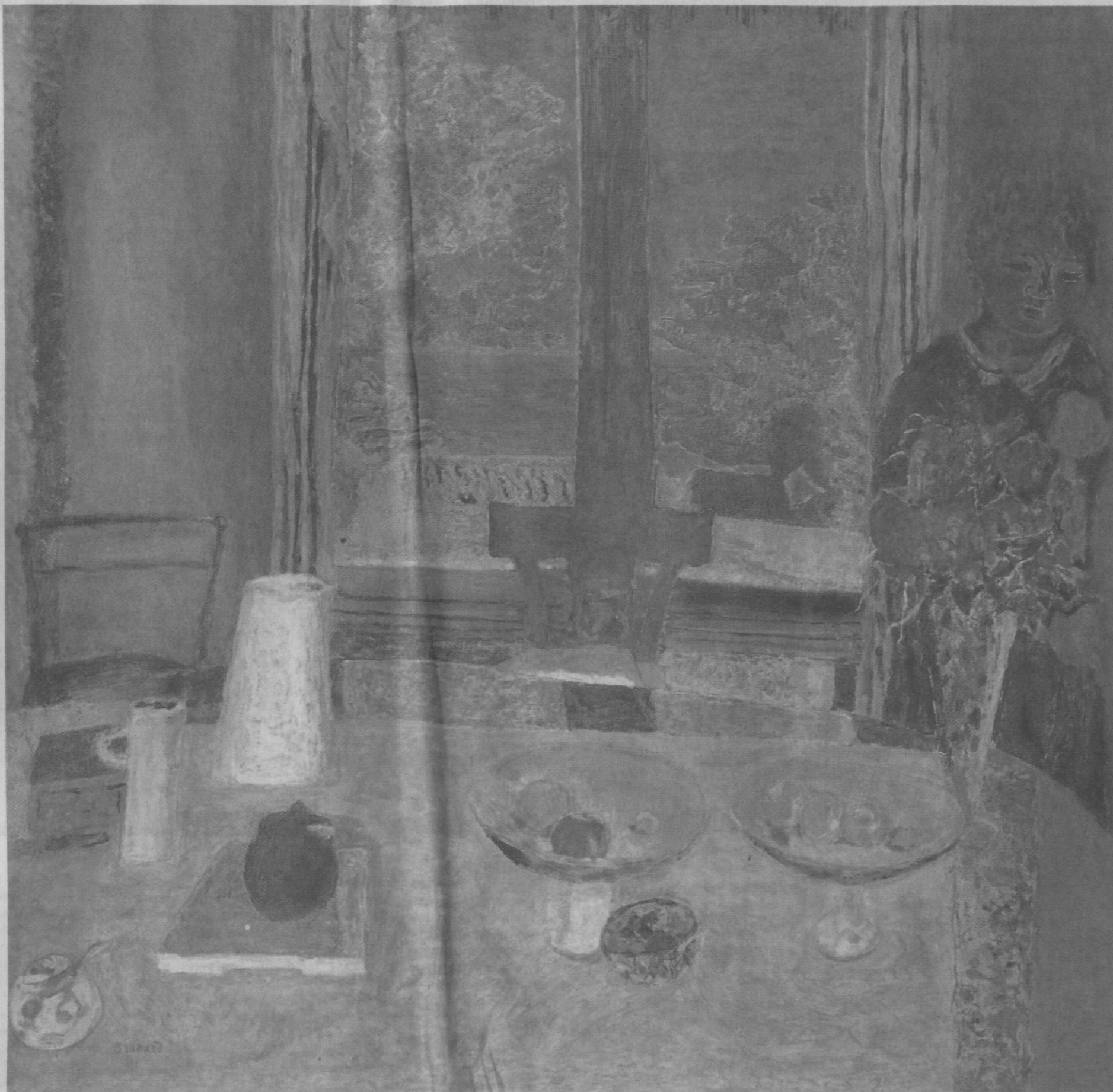
'SALLE A MANGER A LA CAMPAGNE', 1934-35. OLIE OP DOEK.

Als het gaat om het tot zijn recht laten komen van het licht, dan hoeft er niet veel meer te gebeuren dan dat men zich opstelt op een plek waar het licht in ruime mate voorhanden is. Dat deed Bonnard dan ook. Voor de rest had hij geen noeg aan wat er om hem heen gebeurde. Aan gedekte tafels, aan zijn vrouw in een stoel of in de badkamer, aan het uitzicht vanuit zijn raam of zijn terras. Daar kon het eigenlijk bij blijven. Hij schildert geen huiselijke tafereeltjes omdat hij daar zo van hield, of om een burgerlijke geborgenheid gestalte te geven, maar omdat het voor zijn doel eenvoudig niet nodig was om de deur uit te gaan.