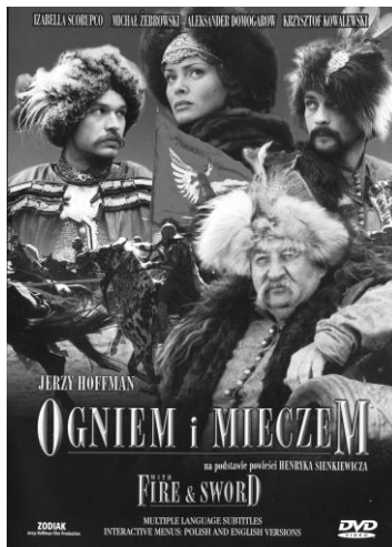
Afb. 1: Ogniem i Mieczem (Jerzy Hoffman, 1999)

Ogniem i Mieczem , Pan Tadeusz en Katyni gaan over drie verschillende periodes in de Poolse geschiedenis: het midden van de zeventiende eeuw, het begin van de negentiende eeuw en de Tweede Wereldoorlog en haar onmiddellijke nasleep. Toch hebben zij heel wat gemeen: dezelfde acteurs spelen in verschillende films, die gemaakt werden door regisseurs die eerder al hun sporen hadden verdiend en hun script baseerden op enkele klassiekers uit de Poolse belletristie.