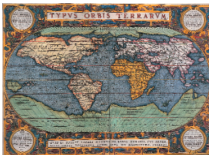
Typus orbis terrarum. Ab. Ortelius describ[ebat] cum privilegio decennali 1587. [Schaal circa 1:83.000.000, ovale projectie]. Kopergravure, gekleurd, 355 x 490 mm. In: A. Ortelius, Theatrum orbis terrarum . Antverpiae, officina Plantiniana, 1592 [COLLBN Atlas 41].