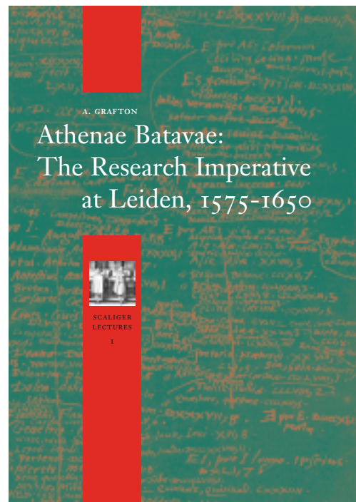
A. Grafton, Athenae Batavae: The Research Imperative at Leiden, 1575-1650 . Leiden, Primavera Pers, 2003. ISBN 90-74310-93-1.