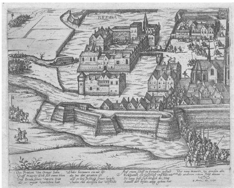
Afb.1: Weergave van het beleg van Breda in maart 1590 (ets, toegeschreven aan uitgever Hogenberg, Keulen; foto: Rijksprentenkabinet, Amsterdam, FM9992B).

Spaanse soldaten zou ondersteunen en rechtsonder is ook nog de aftocht van het Spaanse leger ingetekend, het einde van het verhaal. 9 De toeschouwer van dit type prenten moest al enigszins op de hoogte zijn van het verloop van de gebeurtenissen of via toelichtende teksten nader geïnformeerd worden om de afbeeldingen goed te kunnen begrijpen.