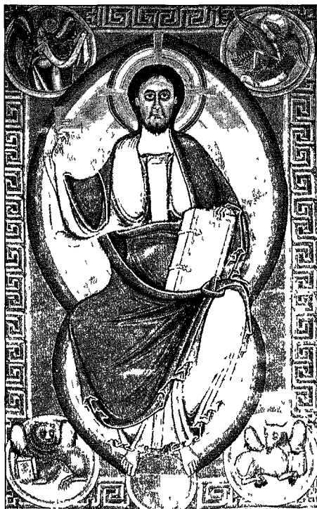
Christus in zijn majesteit, elfde eeuw, abdij van Stavelot, België. Op de hoekpunten de vier evangelisten

op allen die Jezus toebehoren (Romeinen 5:15). Het maakt weinig uit of men in dit geval van Gods gunst, zijn genade, rechtvaardigmaking, heil, verzoening, of van Gods Geest spreekt. Waar het om gaat is, dat christenen direct na Jezus' dood vertrouwden, dat God zijn gunst zowel aan Jezus als aan henzelf had geschonken.