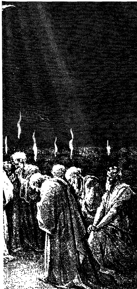
Gravure Gustave Dore

Handelingen over het moment van Jezus' hemelvaart meldt.