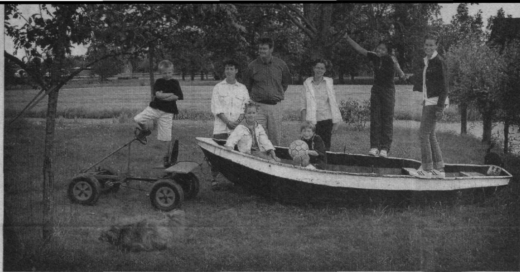
„Een pleegkind wordt al snel eigen. Ook dan houden pleegouders doorgaans inderdaad niet op dezelfde manier van hun pleegkind(eren) als van hun eigen kind(eren). Maar dat is niet verwonderlijk: ook van verschillende eigen kinderen houden ouders niet op dezelfde manier.

Je kunt van een pleegkind nooit zo veel houden als van een eigen kind - Deze gedachte lijkt veel mensen intuïtief van pleegzorg te weerhouden. Het feit dat het om een vreemd