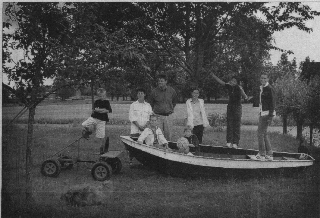
„Een pleegkind wordt al snel eigen. Ook dan houden pleegouders doorgaans inderdaad niet op dezelfde manier van hun pleegkind(eren) als van hun eigen kind(eren). Maar dat is niet verwonderlijk: ook van verschillende eigen kinderen houden ouders niet op dezelfde manier. Ieder kind is nu eenmaal uniek.“

De auteurs zijn respectievelijk moeder van zeven pleegkinderen en vader van een pleegzoon.