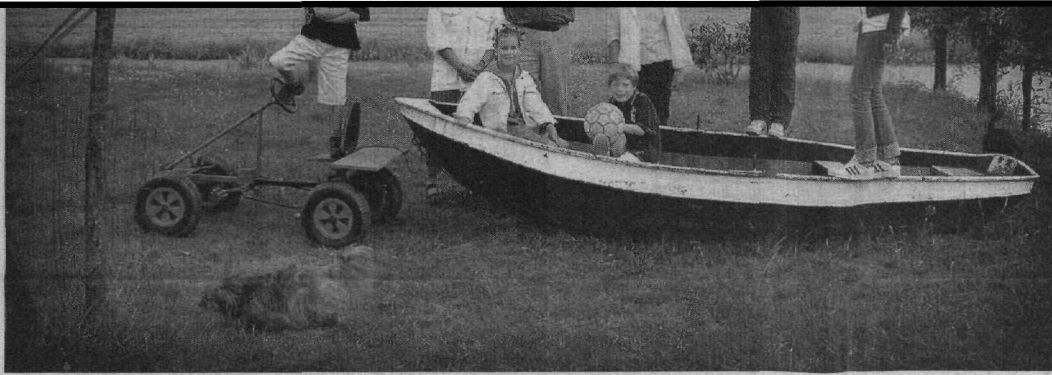
„Een pleegkind wordt al snel eigen. Ook dan houden pleegouders doorgaans inderdaad niet op dezelfde manier van hun pleegkind(eren) als van hun eigen kind(eren). Maar dat is niet verwonderlijk: ook van verschillende eigen kinderen houden ouders niet op dezelfde manier. Ieder kind is nu eenmaal uniek.”

Je kunt van een pleegkind nooit zo veel houden als van een eigen kind - Deze gedachte lijkt veel mensen intuïtief van pleegzorg te weerhouden. Het feit dat het om een vreemd