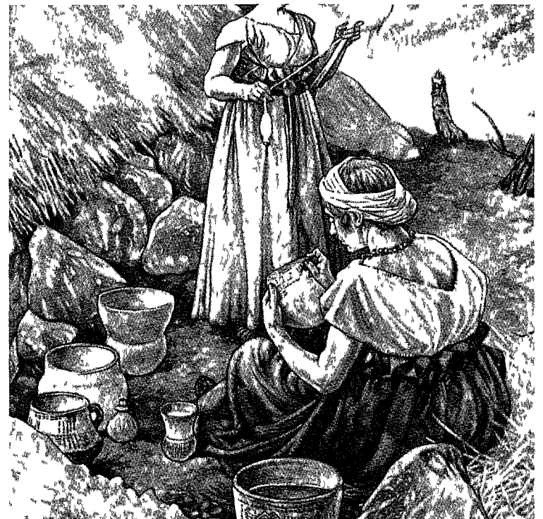
Pottenbakster bezig het kenmerkende trechterbeker aardewerk te versterken

Het is zeer begrijpelijk dat Isings juist de hunebedbouwers uitkoos voor de enige prehistorische plaat die hij maakte. Hij deed ervoor een uitgebreid bronnenonderzoek en maakte een compositie op basis van allerlei tekeningen in de toen gangbare populariserende literatuur. Daaraan ontleende hij de potten-