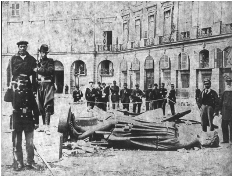
Afb. 2: Communards bij het omvergehaalde standbeeld van Napoleon op de place Vendôme.

Voor de jonge socialistische beweging was het netto resultaat van de Commune uitgesproken ambivalent. Natuurlijk was hier sprake van een verpletterende nederlaag die de Franse arbeidersbeweging voor jaren uiteensloeg. Woordvoerders, lokale organisatoren en zelfs de gewone aanhangers waren gesneuveld, gevangengezet, werden naar de strafkolonie Nieuw-Caledonië in de Stille Oceaan verbannen of gedwongen naar het buitenland te vluchten. Bovendien kwam het socialisme wereldwijd in een kwade reuk te staan doordat het de ‘misdaden van de Commune’ nog jarenlang voor de voeten geworpen kreeg.