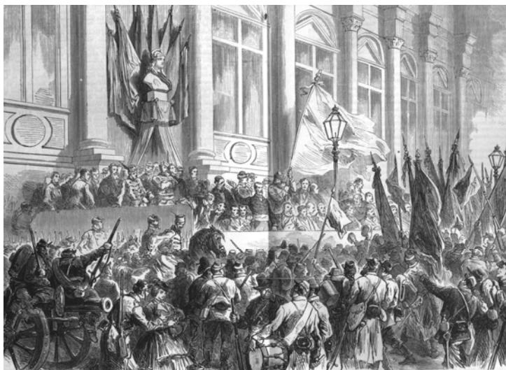
Afb. 3: De revolutie in uniform: na verkiezingen werd de Commune op 28 maart 1871 officieel uitgeroepen ten overstaan van circa 200.000 Nationale Gardisten.

en later het anarchisme optrad, toonde zich op dit terrein wel uitzonderlijk productief. Jaar na jaar, van 1880 tot zelfs ver in de Eerste Wereldoorlog, droeg hij zorg voor het in maart en mei bijna ritueel verschijnen van hoofdartikelen in Recht voor Allen en De Vrije Socialist onder titels als '18 maart 1871', 'Gedenk de Commune!', 'Maartoverdenkingen', 'Bloedige meidagen' of het pakkende 'Vergeet de heldendaden uwer voorgangers niet'. 25