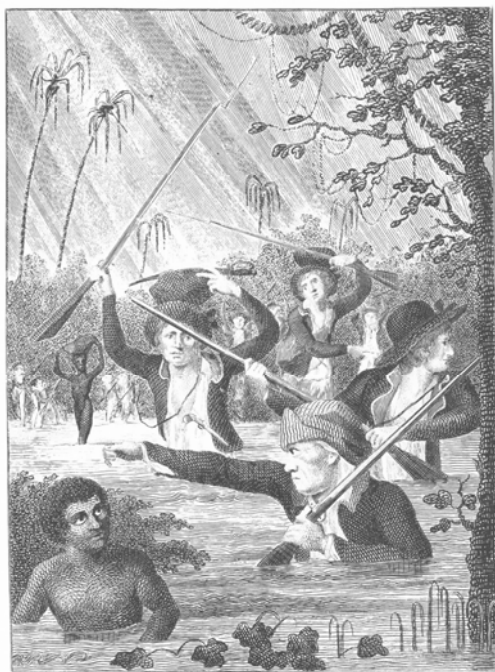
March thro' a swamp or Marsh in Terra-forma.

cijfers niet veel anders. Tussen 1702 en 1744 kwamen er op Curaçao in totaal 700 soldaten aan, hiervan stierven er 166 in het eerste jaar (23%). Van