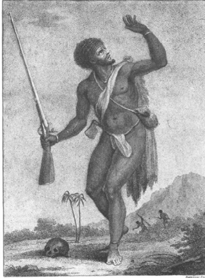
A Rebel Negro armed, on his guard.

samenhangende Atlantische wereld, waarbij West-Europa, West-Afrika en de Nieuw Wereld nauw met elkaar waren verbonden.