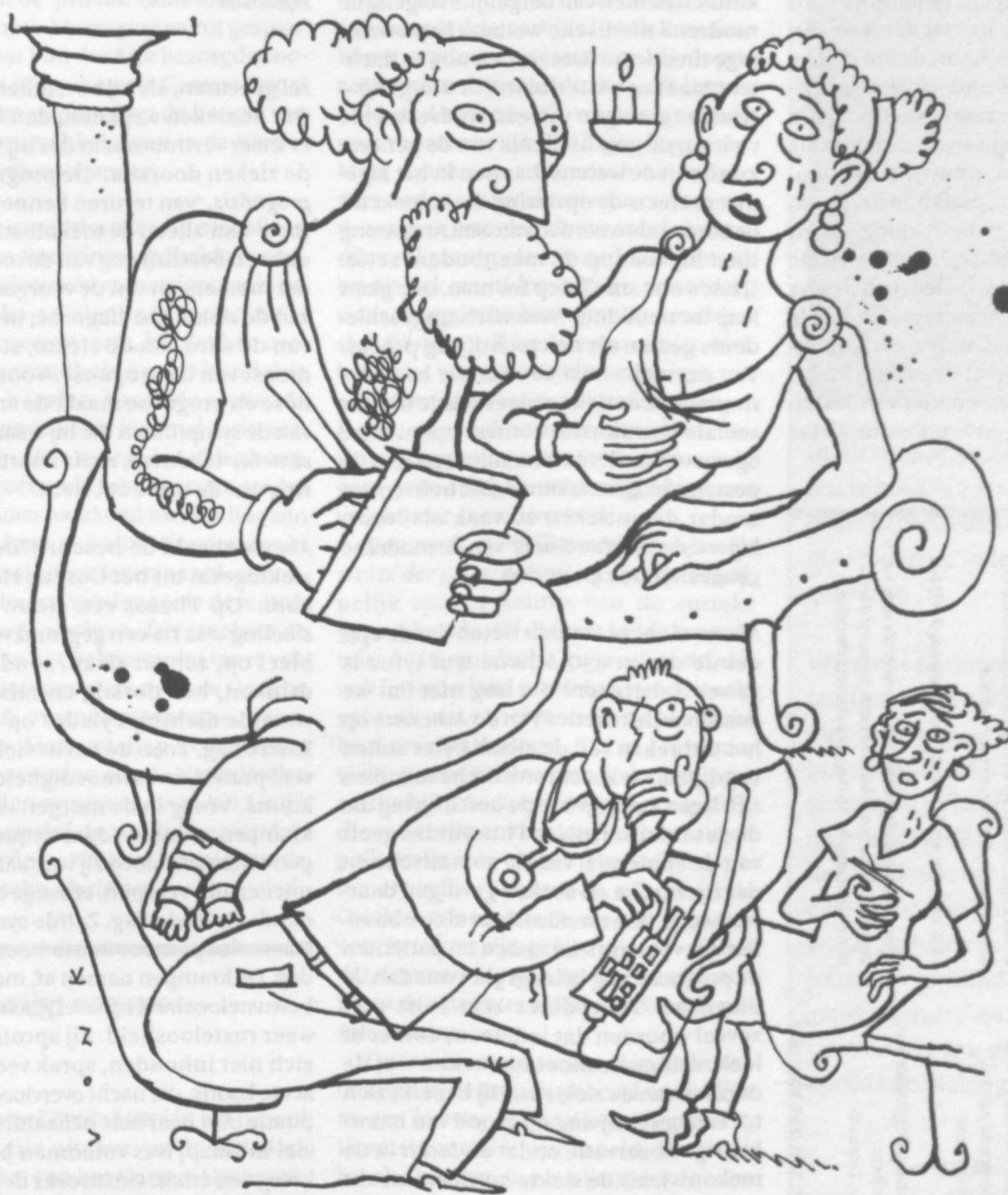
Tekening: Berend Vonk.

Vrijwel jaarlijks verschijnt in belangrijke medische tijdschriften, zoals The New England Journal of Medicine , weer een nieuwe retrospectieve diagnose, een poging om achteraf de aard van de ziekte vast te stellen. Zo zijn al genoemd: antrax, builenpest, cholera, het ebolavirus, ergotisme, influenza, knokkelkoorts, lassa-koorts, mazelen, pokken, tyfus en nog vele andere aandoeningen. Zodra er een nieuwe infectieziekte bekend is, meent men deze in de beschrijving van Thucydides te herkennen. Dat stemt tot sceptis. Ook deze keer bleek die gerechtvaardigd. Een paar weken later aanvaardde hetzelfde tijdschrift een artikel waarin de