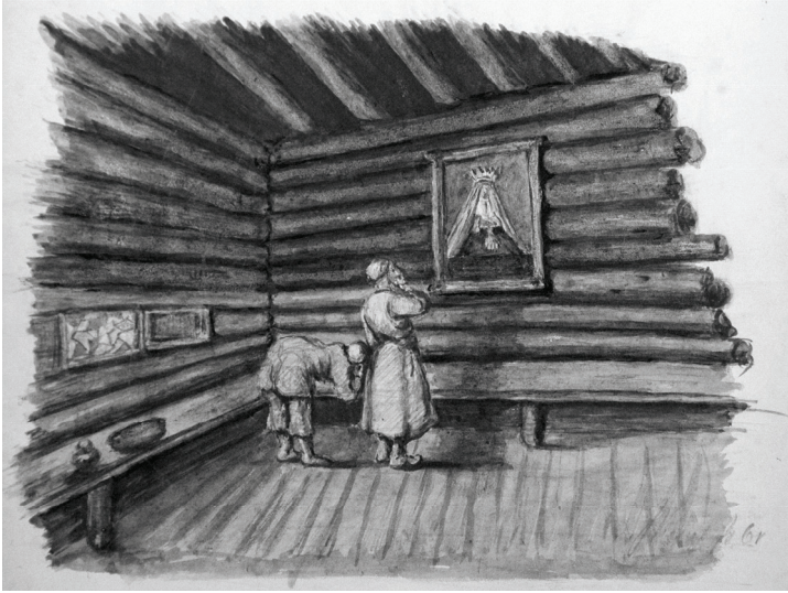
Afb. 2: H.Th. Verhoef. Interieur van een Russische boerenwoning . De personen betuigen hun respect voor een afbeelding van Maria aan de muur. Voor krijgsgevangenen was het cruciaal om te knielen en kruistekens te maken bij dergelijke afbeeldingen, omdat de Russische bevolking hen anders als ongelovigen behandelde. Tekening in kleur uit manuscript.

Vreemd was ook het tabaksgebruik van de Russen. Chirurgijn Verhoef tekende op: