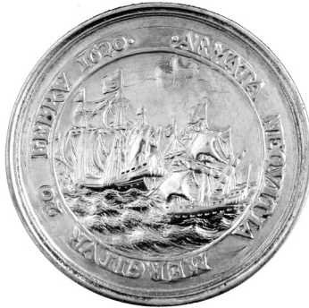
afb. 3: Achtervolging op zee. Keerzijde van de zilveren penning, 1620. Een niet nader gedefinieerd (Nederlands?) schip lijkt de achtervolging te hebben ingezet op een schip met Turkse vlag. Collectie Het Scheepvaartmuseum, inv. nr. A0023(090)2.

gewapende zeerovers worden verdronken, 20 februari 1620'. Collectie Het Scheepvaartmuseum, inv. nr. A.0023(090)1.