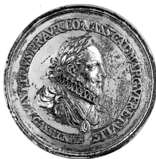
afb. 2: Zilveren penning, geslagen bij gelegenheid van het bestrijden van de Algerijnse vloot op 20 februari 1620. Prins Maurits staat geharnast afgebeeld, met lauwerkrans en Spaanse kraag. De vertaling van het Latijnse omschrift luidt: 'De