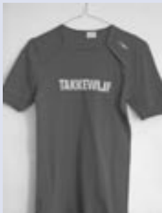
Afbeelding 1. Takkewijf.

Staat u mij toe dat ik deze bijeenkomst begin met een tweetal opmerkelijke uitspraken. Het ANP meldt op 20 mei 2006 het volgende: “Minister Gerrit Zalm van Financiën heeft donderdag excuses aangeboden aan zijn collega Rita Verdonk (Vreemdelingenzaken en Integratie), omdat hij een uitspraak over haar had gedaan die ‘ronduit ongepast is’. Hij zou haar hebben omschreven als ‘takkewijf’. De tweede die ik onder uw aandacht wil brengen, is het onthullende misverstand dat met buitensporige pretenties gepreekt wordt door de initiatiefnemers van de zogenaamde witte spelling 2006. Die verkondigen gratis en lukraak: