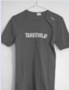
Afbeelding 1. Takkewijf.

Staat u mij toe dat ik deze bijeenkomst begin met een tweetal opmerkelijke uitspraken. Het ANP meldt op 20 mei 2006 het volgende: “Minister Gerrit Zalm van Financiën heeft donderdag excuses aangeboden aan zijn collega Rita Verdonk (Vreemdelingenzaken en Integratie), omdat hij een uitspraak over haar had gedaan die ‘ronduit ongepast is’. Hij zou haar hebben omschreven als ‘takkewijf’. De tweede die ik onder uw aandacht wil brengen, is het onthullende misverstand dat met buitensporige pretenties gepreekt wordt door de initiatiefnemers van de zogenaamde witte spelling 2006. Die verkondigen gratis en lukraak: