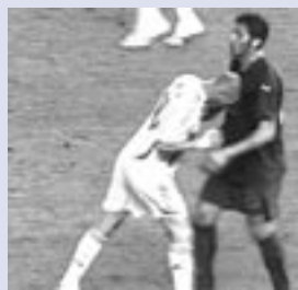
Afbeelding 2. Kopstoot Zinédine Zidane 2006.

uitmaakte. Andere media in Frankrijk geloven dat Materazzi een beledigende opmerking maakte over Zidane's moeder. Op de Franse betaalzender Canal Plus liet Zidane los dat de beledigingen zo ernstig waren dat ze hem verplichtten zich te gedragen als een man. Interviewer: "Wat zei hij precies?" Zidane: "Het was erg wat hij zei." Toegegeven, veel wijzer worden we niet van zo'n antwoord. De Italiaanse verdediger op zijn beurt geeft toe dat hij de Franse middenvelder beledigd heeft. "Ik hield het shirt van Zidane een paar seconden vast", begint Materazzi zijn verhaal. "Hij draaide zich om en bekeek mij van kop tot teen. Hij deed dat op een arrogante manier. Als je echt mijn shirt wil, dan zal ik het na de wedstrijd geven ", zei Zidane. Ik heb toen geantwoord met een belediging." Wij, de toeschouwers, nemen zonder aarzeling aan dat het een kwaadsappige insinuatie geweest moet zijn.