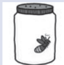
Afbeelding 5. Fuck!

Corpus gesproken Nederlands 36 en de mogelijkheid om grote hoeveelheden tekst via het World Wide Web te raadplegen, het web als corpus dus, heeft iedere grond onder dat excuus weggeslagen.