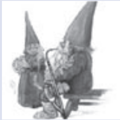
Afbeelding 6. De ouderdom.