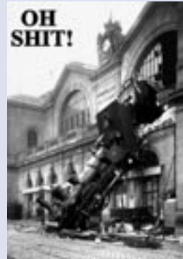
Afbeelding 3. Verwensing Shit.

stelde ik mij daardoor onder meer ten doel. Mijn monografie had ons immers geleerd dat woordenboeken onwelvoeglijke taal ofwel niet beschrijven of, als ze het wel doen, uiterst summier.