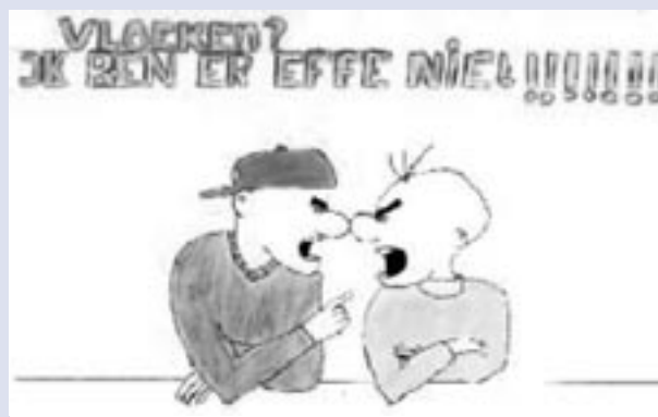
Afbeelding 4. Vloeken.

2006: “De hoofdredacteur verdient de bescherming van de anonimiteit omdat hij/zij vanaf het kathedersprek. Dan kun je niet meer de schouders ophalen, en denken: goh, dat zie ik toch een slagje anders. Dan moet je de schrijver zo serieus nemen als kan. En dan moet je je in dit geval de vraag stellen: is NRC Handelsblad nu helemaal gek geworden?”