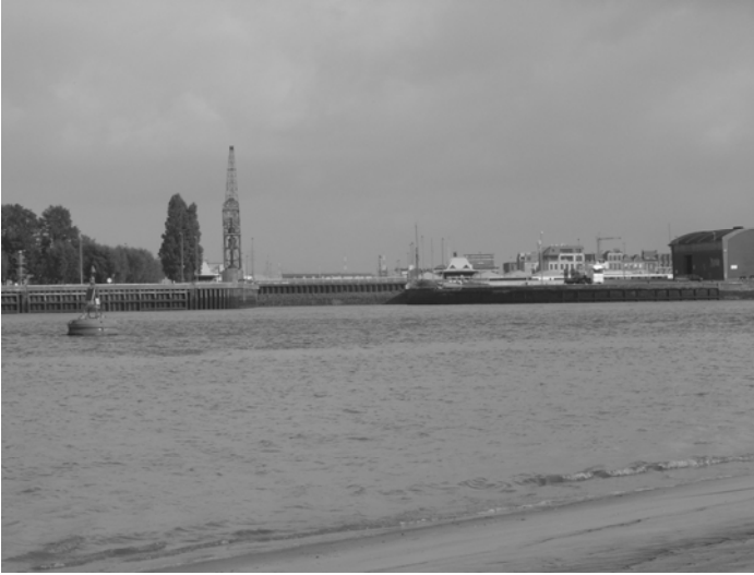
Afb. 6: Plaats van herinnering? Aan de overzijde van de rivier, rechts van de twintigste-eeuwse havenkraan, bracht Van Speijk op 5 februari 1831 Z.M. kanonneerboot No. 2 tot ontploffing (foto 2007).

Op de plek waar Van Speijk in 1831 zijn boot opblies herinnert nu niets meer aan die daad. Elders in de publieke ruimte zijn wel nog tastbare herinneringen aan de kordate kanonneerbootcommandant te vinden. De belangrijkste zijn twee monumenten, zestig straten en een schip. Dit laatste, het fregat Van Speijk , is het jongste marinevaartuig in een historische reeks van acht dat die naam heeft gekregen als uitvloeisel van het koninklijk besluit van 11 februari 1831. Anno 2007 werken de Nederlandse en Belgische marine samen en opereert Hr. Ms. Van Speijk geregeld in een Belgisch-Nederlands eskader dat taken uitvoert, ‘variërend van opleidingen, vlagvertoon tot ernstinzet’. 77 Ironie ligt voortdurend op de loer wanneer heden en verleden met elkaar worden geconfronteerd, niet in de laatste plaats als er heldendom in het geding is. Die ironie vlakt echter niet uit dat Jan van Speijk het kwakkelend nationaal zelfvertrouwen destijds in één klap wist te herstellen.