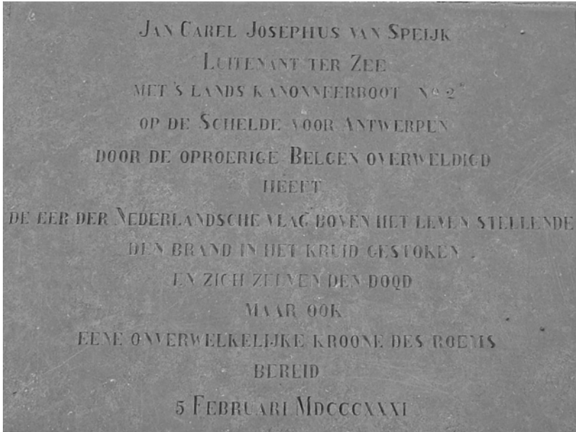
Afb. 5: Gedenkplaat op het nationaal Van Speijkmonument te Egmond aan Zee, ingewijd in 1840 (foto 2007).

de verwoeste kanonneerboot. 54 Naar aanleiding van dat bericht had hij de Belgische militaire bevelhebber verzocht om overdracht van het stoffelijk overschot.