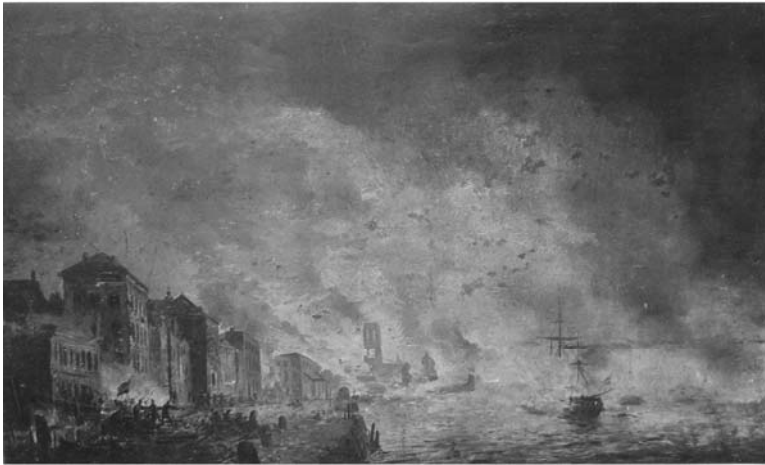
Afb. 2: Beschiëting van Antwerpen door de Hollandse vloot , geschilderd in 1831 door Ferdinand de Braekeleer (1792-1883). Nationaal Scheepvaartmuseum,

wegens betoonde moed, beleid en trouw. 19 De ‘tuchtiging’ van Antwerpen werd na de deconfiture van Brussel enthousiast onthaald in Noord-Nederland, 20 waar een van de vaderlandse dichters de door hemzelf opgeworpen vraag ‘Wie zal in de Historieblaân / naast Maurits, Fredrik, Willem staan?’ enigszins voorbarig beantwoordde met: ‘Chassé, Chassé, Chassé!’ 21 ‘Van Speijk’ was eind 1830 in ieder geval nog geen bekende naam.