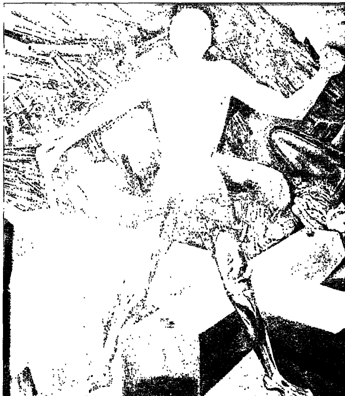
Orozco: Christus protesteert tegen de valse lijdensmystiek

T en tweede. Ook het feit dat Paulus geen aparte hemelvaart van Jezus kent, los van de opstanding, wijst erop dat volgens Paulus Jezus niet uit zijn graf getreden en weer tijdelijk op aarde teruggekeerd is. Bij Paulus is de opstanding van Jezus hetzelfde als zijn verhoging in de hemel, zijn intronisatie bij God.