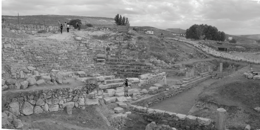
Algemeen zicht van het tempelcomplex: links op de heuvel stond de tempel, in het midden ligt het traptheater, rechts in de vallei bevindt zich de zuilengang.

tot onderaan door, maar eindigen op orthostaten, grote rechtopstaande stenen van circa 1,45m hoog. De constructie is dus een combinatie van een monumentale toegang tot de tempel én een theater voor het bijwonen van religieuze of andere voorstellingen in de orchestra vóór de trap.