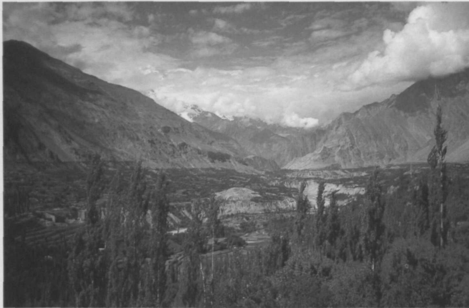
Boven: Eén van de vele vruchtbare valleien ten westen van het Pamirgebergte, in Bactrië (het huidige Noord-Pakistan).