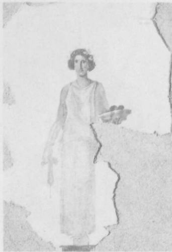
Rechts: Onder keizer Augustus verbreidde de zijde-mode zich in een stroomversnelling onder de Romeinse elite; fragment van een wandschildering met een modieuze Romeinse dame in zijden robe. Uiterst Rechts: een T-vormige zijden banier uit de tijd van keizer Wu-ti; ongetwijfeld werd ook dit soort zijdewerk verhandeld langs de vroegste route tussen China en het Avondland. Onder: Zwaarbepakte Bactrische kameel, zoals er langs de Zijderoute veel te zien waren.