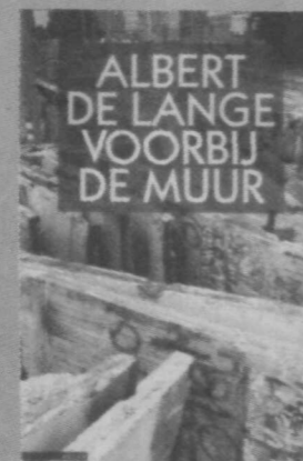
Berlijnse reportages, deels afgedrukt in Het Parool.

Albert de Lange: Voorbij de muur. Atlas, Amsterdam; 276 blz. f 39,90.