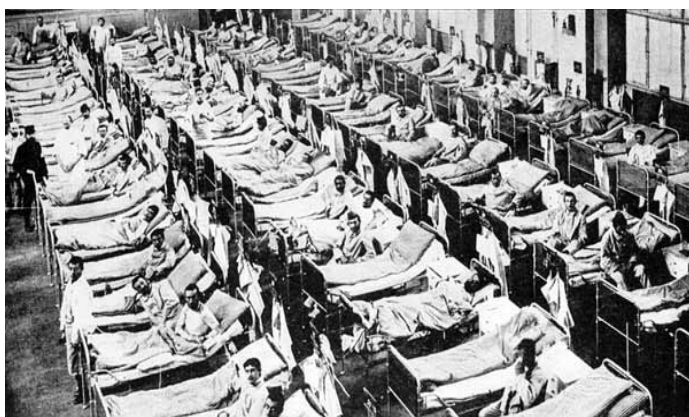
Afb.2: Een overvol oorlogshospitaal in Berlijn.

Kortom, de praktijk van de medische hulp was: teveel gewonden (in alle veelal onbekende soorten en maten), teveel zieken, ondanks de grote aantallen toch te weinig artsen en verpleegkundigen, te weinig materiaal en slechte en veel te kleine hulpposten. In de ziekenhuizen in het achterland was het niet veel beter. Bovendien waren de voorzorgsmaatregelen veelal genomen op grond van, naar later bleek, foutieve veronderstellingen over aard, omvang en duur van de strijd. Ook tijdens de oorlog zelf, voorafgaand aan een grote slag, werd telkens een schatting gemaakt van het aantal gewonden waar de medische zorg op diende te rekenen en ook die schattingen waren zelden accuraat, ofwel: altijd te laag en vaak heel veel te laag. Zo was bij de slag om de Somme, met ‘slechts’ tienduizend doden en gewonden rekening gehouden, terwijl het de Britten alleen al de eerste dag 60.000 man kostte - 20.000 gesneuveld en 40.000 gewond. 12