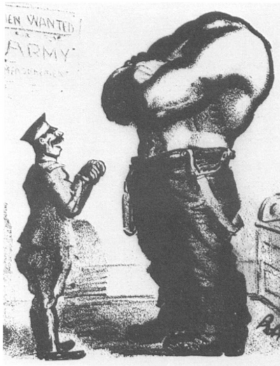
Der Militärarzt: »100 %ig tauglich!« Zeichnung von Robert Minor aus M. Hirschfelds »Sittengeschichte des Ersten Weltkrieges«

Een deel van de artsen die deze opvattingen omarmden begonnen oorlog als een collega te zien. Oorlog kon zorgen voor een grote schoonmaak onder de zwakke delen van de natie, waardoor het geheel sterker en gezonder zou worden. Een voorbeeld was de extreem-rechtse hoogleraar Max von Gruber, een fervent aanhanger van de rassenhygiëne. In zijn ogen was het niet van belang dat ‘wij onvolmaakten’ voortleefden, maar ‘dat de Duitser zich verwezenlijkte, te voorschijn kwam, zich bewees