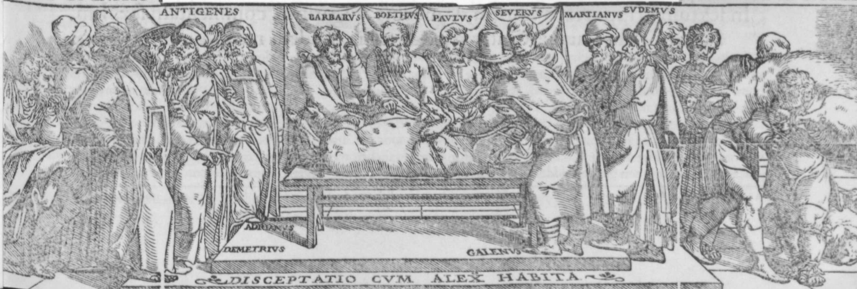
DISCEPTATIO CVM ALEX HABITA