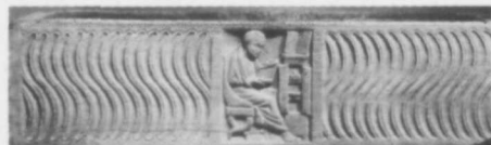
Romeinse Strigilissarcofaag, New York, Metr. Mus. of Art.

gulle hand weldaden om zich heen strooiden: subsidies voor openbare bouwwerken, sporttoernooien en feesten. Wie zich daaraan wilde onttrekken kon op sancties rekenen. Was onze anonymus daarom zo bang om zich te verantwoorden? 'Het drankje van Philon' is waarschijnlijk een geneesmiddel