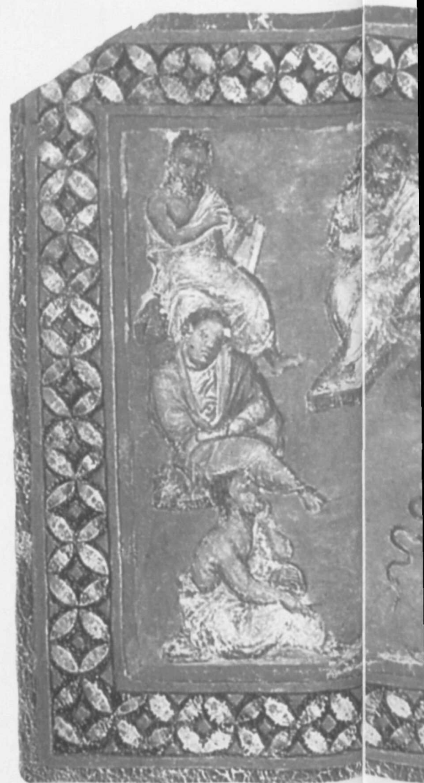
I. Galenus (midden boven) en zes andere beelden uit het Weense Dioscurideshandschrift, Nationale Bibliotheek

'Een liefdesrelatie met een vrouw...' Wie was die vrouw? Een medeslavin? Slaven konden geen legitieme relatie aangaan. Was de vrouw de meesteres? In dat geval hingen de slaaf zeker straffen boven het hoofd. Beide simulanten hebben een kwaal gekozen die bij hun stand past. Spijsverteringsproblemen waren bij de beter gesitueerden aan de orde van de dag. Zo werd Galenus ook