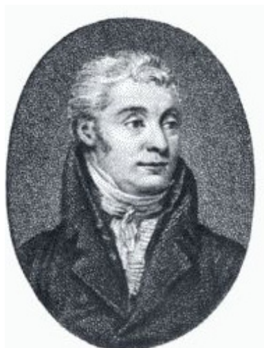
A.F.J.A van der Duyn van Maasdam (1771-1848)

De commissie kwam van 27 december 1813 tot en met begin maart 1814 bijeen in het huis van Van Hogendorp op de Haagse Kneuterdijk. De besprekingen vonden plaats op basis van de ‘Schets van de Grondwet’, die Van Hogendorp voor aanvang naar alle commissieleden had gestuurd. Dit document was reeds de derde versie van de ‘Schets’. De eerste ‘schets’ had Van Hogendorp in 1812 geschreven tijdens Napoleons tocht naar Rusland. 9