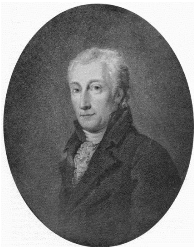
G.K. van Hogendorp (1762-1834)

gaan voorbereiden. 7 Deze grondwet zou de basis vormen van het nieuw te vestigen Koninkrijk der Nederlanden. Op 29 en 30 maart 1814 werd deze grondwet door een vergadering van 474 zogenaamde notabelen goedgekeurd. 8